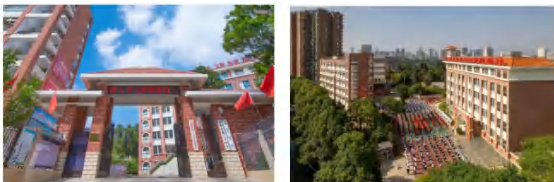
昆明市第三十中学（南菁学校）

近年来，五华区全面贯彻党的教育方针，在省、市两级政府的坚强领导下，始终将教育置于优先发展的战略地位，坚定实施教育兴区、人才强区的战略。通过深入推进教育教学提质培优三年倍增计划，五华区的现代教育体系日益完善，教育资源更加优质均衡，教育高质量发展不断取得新进展。