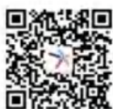
昆明市五华区武成小学