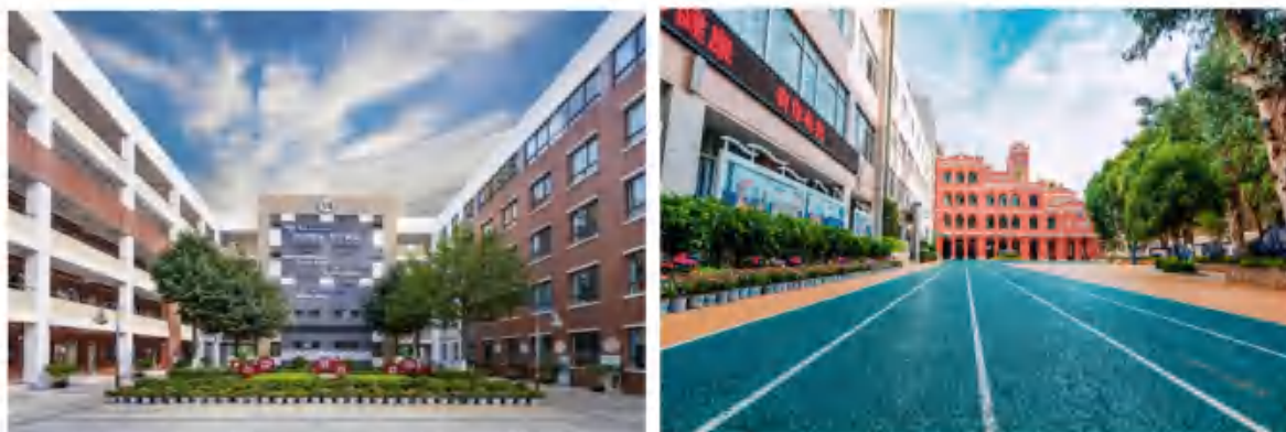
昆明市五华区武成小学

以制度建设为引领，助推教师队伍建设。出台了《五华区减轻中小学教师负担进一步营造教育教学良好环境的实施方案》《五华区关于加强和改进新时代师德师风建设的实施意见》《五华区教育教学提质培优三年倍增计划（2023—2025年）》等23个制度性文件，为五华教育的发展提供了坚实的制度保障。通过“人才领航·基础教育质量示范引领建设”五年行动计划，五华区深入推进“十百千名师名校长培育”工程，优化师资结构，努力培养更多的高级教师、骨干教师和学科带头人。目前，五华区已培养高级及以上教师1200余人，省、市、区级各类名师名长2000余人，全区专任教师中骨干教师占比超过50%。五华区还建立了国家教育部领航工程名校长工作室1个，省级名校长工作坊3个，为教师队伍的成长提供了良好的平台。