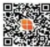
昆明市五华区莲华小学