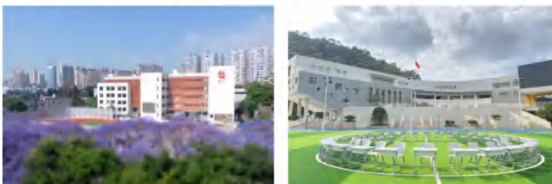
昆明市五华区莲华小学

区还入选了云南省第一批学校体育综合改革试点县区，学生体质健康监测优良率连续两年超过全国平均水平。