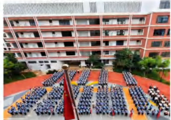
昆明市五华区莲华中学