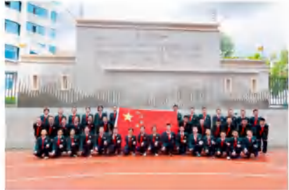
昆明市五华区华山中学

以集团化办学模式，扩充优质教育资源。五华教育将集团化、学区化建设视为教育民生的“头号工程”。通过不断加大义务教育学位供给，持续扩充优质教育资源，五华区构建了“纵向学区化、横向集团化”的发展格局，形成了“一体三翼”的高质量发展新格局。目前，五华区已成立了12个公办教育集团，覆盖公办校园47所，优质教育资源的辐射范围不断扩大。五华区将继续深化教育集团“团队式”管理帮扶，通过整合资源、发挥优势、互相学习，形成了教研、学习共同体，带动薄弱学校共同发展。同时，通过“区管校聘”机制，加强集团内教师的合理流动，实现了优质教学资源的互补共享，有效促进了学校内涵发展和质量提升。