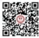
昆明市五华区红旗小学