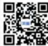
昆明市五华区文泽小学

五华区是云南省省会昆明市的中心城区，毗邻云南省政府五华山，地处翠湖之畔。这片土地历史悠久，人文气息浓郁。这里是科教、文化、商贸、金融、通讯等机构的聚集地，拥有包括云南大学在内的 11 所高等院校，以及昆明物理研究所等 30 多个科研机构。这