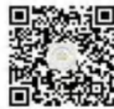
昆明市五华区莲华中学