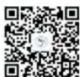
昆明市第三十中学（南菁学校）