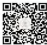
昆明市五华区华山中学