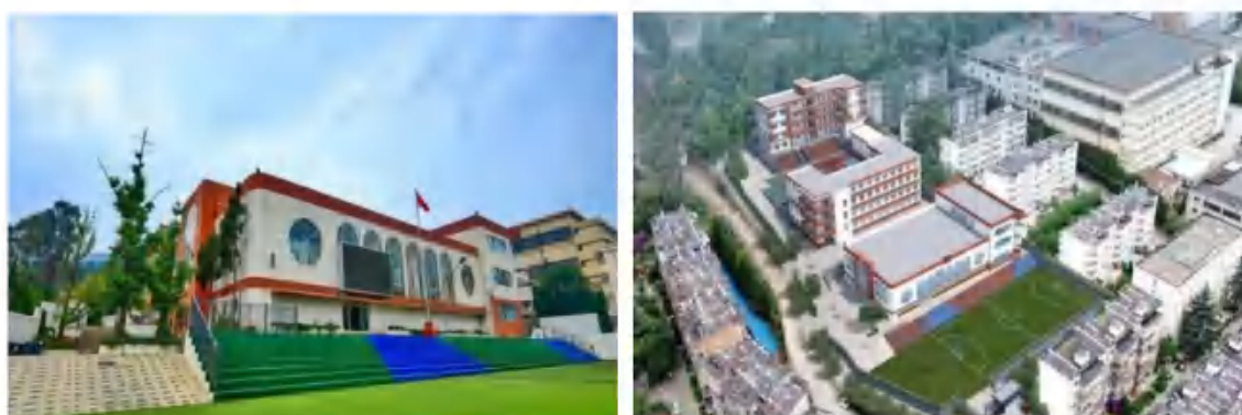
昆明市五华区文泽小学

五华区教育人不断总结教育教学经验，补齐发展短板，全力打造教育教学高质量、师资队伍高质量、教育保障高质量的“三高”教育目标，全速推进全区教育高质量发展。如今，五华教育这块“金字招牌”更加闪亮，先后被授予“全国推进义务教育均衡发展工作先进地区”“全国中小学心理健康教育示范区”“全国科学教育实验区”等荣誉称号，被云南省教育部门表彰为“云南省两基工作先进单位”，两次荣获“云南省教育工作先进县”，连续多年荣获昆明市教育教学质量一等奖。