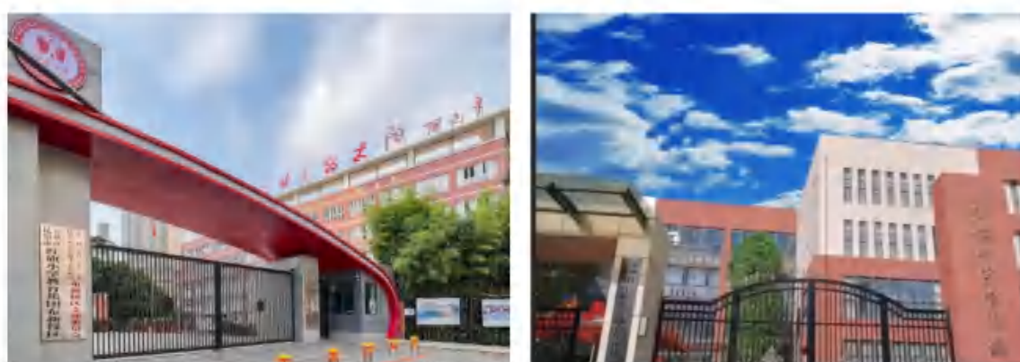
昆明市五华区红旗小学

南省工业和信息化厅 2022 年人工智能省级示范项目。目前，五华区已实现个性化学习系统覆盖全区初高中，智慧微课系统、智慧课堂作业平台覆盖全区 11 所中学和 33 所小学，所有中学实现了智慧平板现代化教育模式。这些智慧教育系统的引入，为学校高质量教育教学提供了有力支持，让信息化产品服务于教育教学，实现了减负增效。