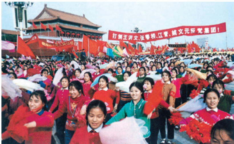
▲首都群众在天安门广场举行集会和游行，庆祝粉碎“四人帮”的重大胜利

“文化大革命”这场灾难。实践证明，“文化大革命”不是任何意义上的革命或社会进步，而是一场由领导者错误发动，被反革命集团利用，给党、国家和各族人民带来严重灾难的内乱。