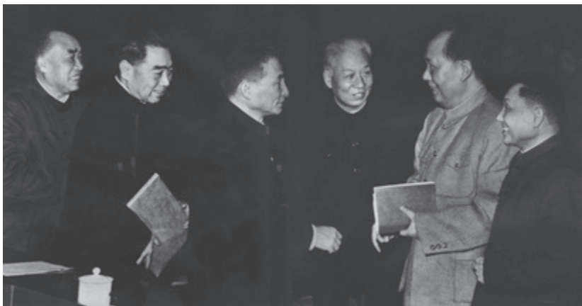
▲ 七千人大会期间，毛泽东、刘少奇、周恩来、朱德、陈云、邓小平在一起

为了克服困难，1961年1月，中共八届九中全会决定对国民经济实行“调整、巩固、充实、提高”的八字方针，同时对政治、文化、教育、科研、民族、知识分子等方面的政策进行重要调整。1962年初召开的七千人大会比较深入地总结了经验，取得了重要成果。1962年下半年到1965年，国民经济稳步增长，接近并超过新中国成立以来最高水平。