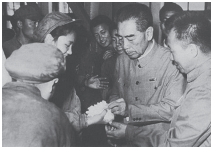
▲ 1971年10月周恩来在北京东方红石油化工总厂视察

1969年4月，中共九大召开。1971年9月，林彪反革命集团策动武装政变，阴谋夺取最高权力。毛泽东、周恩来粉碎了这次政变。1972年，周恩来在毛泽东的支持下主持中央日常工作，批判极左思潮，使各项工作出现转机，但遭到江青等人的反对。1975年，周恩来病重，邓小平主持中央日常工作，领导进行了各方面的整顿，经济形势有了明显好转。这些整顿实际上是后来拨乱反正的预演。江青等人极力反对邓小平领导的整顿，使国民经济再度恶化。