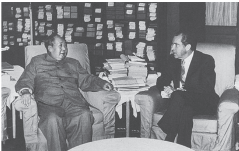
▲ 1972年2月21日，毛泽东在中南海会见美国总统尼克松

20世纪70年代，中国外交打开新局面，迎来了新中国成立以来与世界各国建交的又一次高潮。与中国建交国家的数量从1965年的49个增加到1976年的111个。其中，大多数是发展中国家。1971年，中华人民共和国恢复在联合国的一切合法权利。1972年，中美两国结束了长期敌对状态，开始走向关系正常化；中日正式建交。这些外交成就极大地改善了中国的安全环境，拓展了外交活动的舞台。