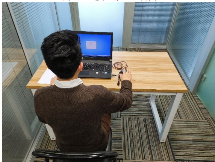
图二：电脑端背面视角