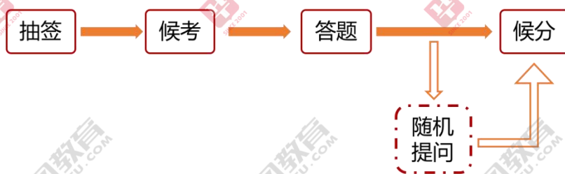
面试考场基本流程图

结构化面试的考场程序对所有参加面试的考生都是完全一样的，每个人都要经过抽签、候考、答题和候分的环节。