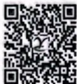
理论测验 答案 5-4