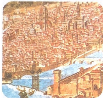
▲ 15世纪的佛罗伦萨（绘画作品）