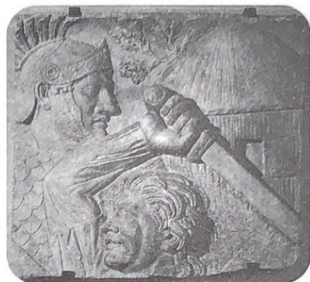
▲ 罗马人与日耳曼人（雕塑）

封君封臣制度是社会动荡和自然经济的产物，8世纪后逐渐与封土联系在一起。当时，地方领主为其家族和亲兵提供土地作为给养。授予土地者为封君，领取土地者为封臣。封臣必须效忠封君，主要义务是服兵役。由于土地被层层分封，各级封建主都是土地事实上的占有者，享有土地上的司法、行政和经济等各种权力。一方面，国王或皇帝是名义上的最高统治者，通过封君封臣制度与各级封