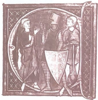
▲ 中古西欧的“三种人”(绘画作品)