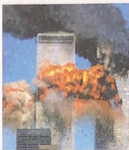
▲ “9·11”事件中被撞击的纽约世贸中心双塔大楼

2001年9月11日，4架美国客机被恐怖主义分子劫持，其中两架先后撞击纽约的世贸中心双塔大楼，造成大楼爆炸起火并最终坍塌；第3架撞击了美国国防部所在地五角大楼的一角，引起大火；第4架在宾夕法尼亚州的田野坠毁。“9·11”事件是美国在和平时期遭受的最严重的恐怖主义袭击，近3000人在这次事件中罹难。