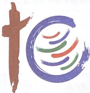
▲ 2011年商务部发布的中国加入世贸组织十周年纪念标识

经济全球化使各国经济相互依存度剧增,人类社会的交往与联系也发展到了前所未有的高度。