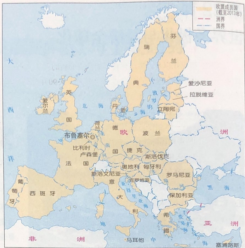
▲ 欧盟成员国示意图

2001年9月11日，4架美国客机被恐怖主义分子劫持，其中两架先后撞击纽约的世贸中心双塔大楼，造成大楼爆炸起火并最终坍塌；第3架撞击了美国国防部所在地五角大楼的一角，引起大火；第4架在宾夕法尼亚州的田野坠毁。“9·11”事件是美国在和平时期遭受的最严重的恐怖主义袭击，近3000人在这次事件中罹难。