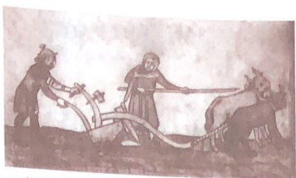
▲ 耕种的农民（绘画作品）