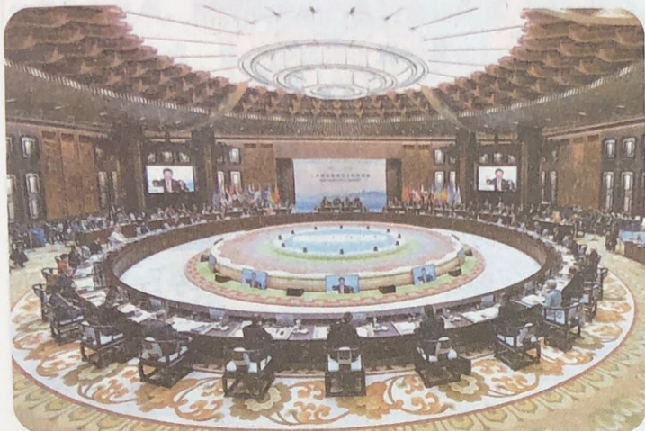
▲ 2016年二十国集团领导人杭州峰会