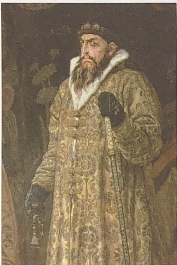
◀ 伊凡四世（1530—1584）（绘画作品）

6—9世纪，东欧大平原上的斯拉夫人进入原始社会解体阶段，贫富分化显现，逐渐形成一些公国，其中以基辅和诺夫哥罗德最为重要。862年，北欧诺曼人首领留里克成为诺夫哥罗德王公，建立留里克王朝。882年，留里克的亲属奥列格占领基辅，并迁都于此，形成以基辅为中心的国家，史称“基辅罗斯”。它一面剥削和掠夺本地斯拉夫人，一面与波罗的海地区和拜占庭进行贸易，逐渐进入封建社会。在政治和文化上，基辅罗斯深受拜占庭帝国影响，如斯拉夫字母是对希腊字母的继承和改造，宗教是拜占庭的东正教。12世纪，基辅罗斯陷入分裂，逐渐衰落。1240年，蒙古远征军攻陷基辅，基辅罗斯随后落入蒙古统治之下。