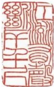
江流有声断岸千尺

约7厘米见方，是一方在马背上烙标记的烙马印。印文造型和构图都较为出奇，虽险绝空灵，但疏而不散。