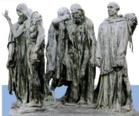
加莱义民(雕塑) 1884~1888 罗丹(法国)

欣赏这些作品，看看其中的形象是否可以清晰地辨识出来，这些形象分别给我们带来什么样的感受？