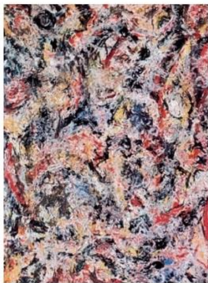
芳香(油画) 1955 波洛克(美国)

波洛克的画摆脱了一切束缚, 追求极端的自由和开放, 促进了人类大胆创新意识的发展。