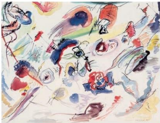
最初的抽象(水彩画) 1910 康定斯基(俄国)

这幅水彩画被认为是抽象派代表画家康定斯基的第一幅抽象画。画家通过抽象的点、线和色彩表现出作品的美感。