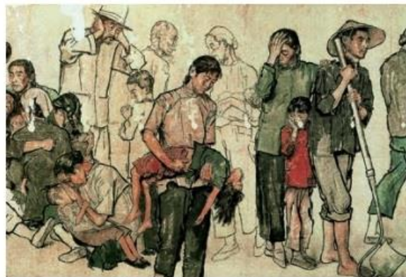
流民图(中国画 局部) 1943 蒋兆和

黄筌注重对生活中实物的观察和形神兼备的描绘，作品中每个动物的描绘都逼真传神，栩栩如生。