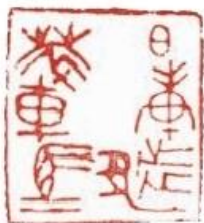
日庚都萃车马 战国 巨玺

约7厘米见方，是一方在马背上烙标记的烙马印。印文造型和构图都较为出奇，虽险绝空灵，但疏而不散。