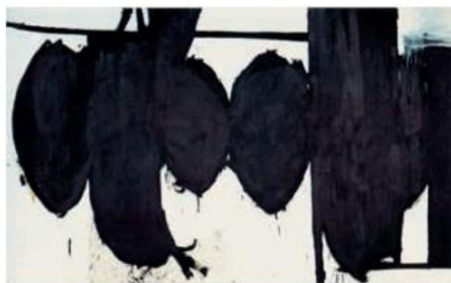
西班牙共和国的挽歌第70号(油画) 1961 马瑟韦尔(美国)

画家以西方现代绘画的形式和油画的色彩技巧, 融入中国传统艺术的意蕴, 创造了色彩变幻、富有张力和韵律感的作品。