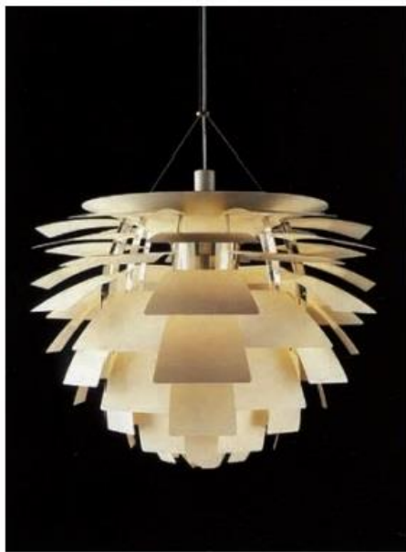
PH灯 1957 亨宁森（丹麦）