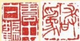
云中白鹤（白文） 敢为（朱文）