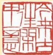
今来古往闲中意 齐白石

章法中，文字之间的挪让变化、相亲顾盼、左右穿插及与四边的关系处理，是一方印的成功所在。白石老人的这款印中，线条的方向安排、粗细变化和文字错落设计得体，穿插有序，值得借鉴。