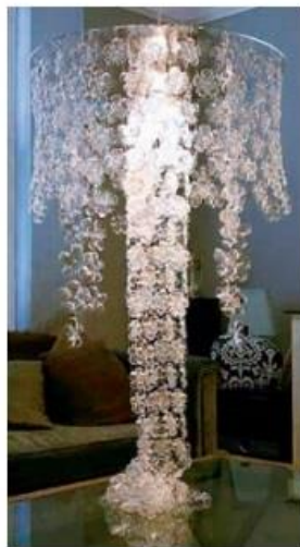
“水晶”吊灯（饮料瓶底）