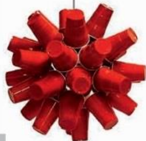
吊灯（一次性塑料杯）