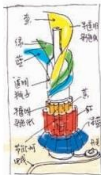
彩虹台灯手绘示意图及实物（彩色硫酸纸、玻璃）