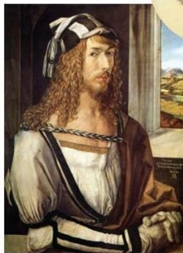
26岁的自画像(油画) 1498 丢勒(德国)

画家少年时就能逼真地画出自己的肖像。他画的动植物素描之精确，完全可以同达·芬奇的作品相媲美。