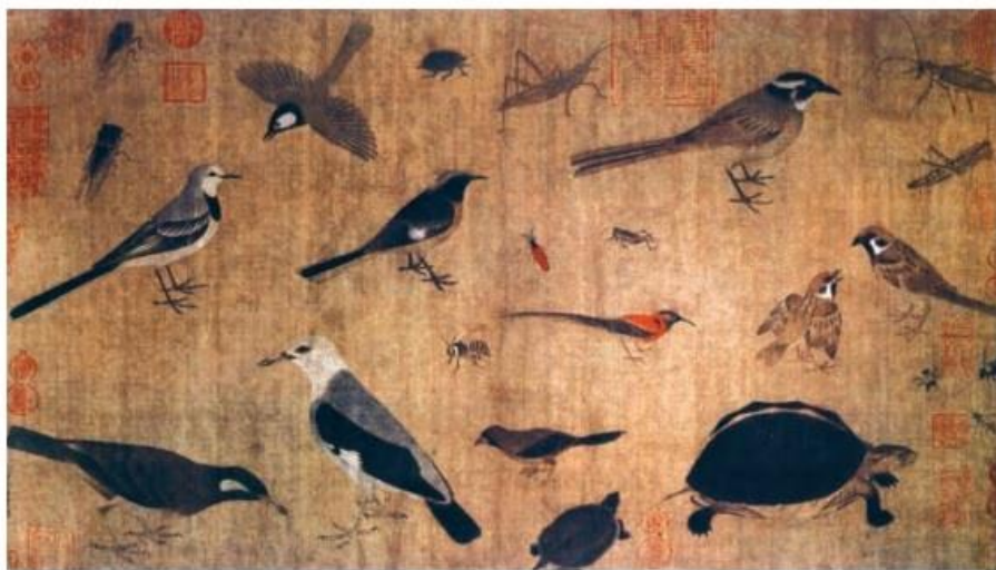
写生珍禽图(中国画 局部) 五代 黄筌

黄筌注重对生活中实物的观察和形神兼备的描绘，作品中每个动物的描绘都逼真传神，栩栩如生。