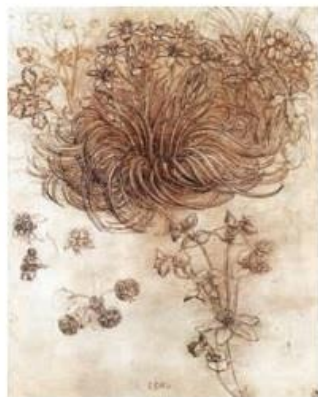
植物研究(素描) 1506~1508 达·芬奇(意大利)

画家少年时就能逼真地画出自己的肖像。他画的动植物素描之精确，完全可以同达·芬奇的作品相媲美。