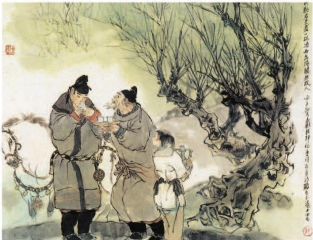
送元二使安西 戴敦邦