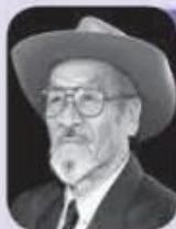
Wang Luobin 王洛宾 (1913—1996)