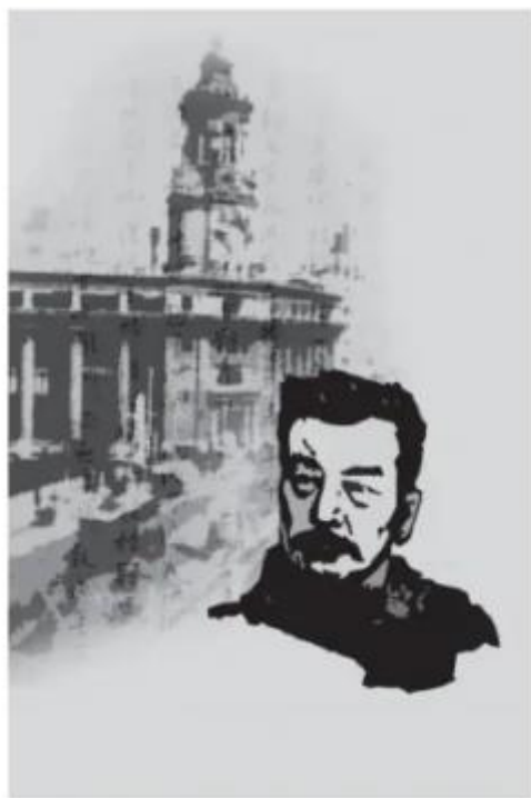
我们要运用脑髓，放出眼光，自己来拿

顺便到欧洲传道。我在这里不想讨论梅博士演艺和象征主义的关系，总之，活人替代了古董，我敢说，也可以算得显出一点进步了。