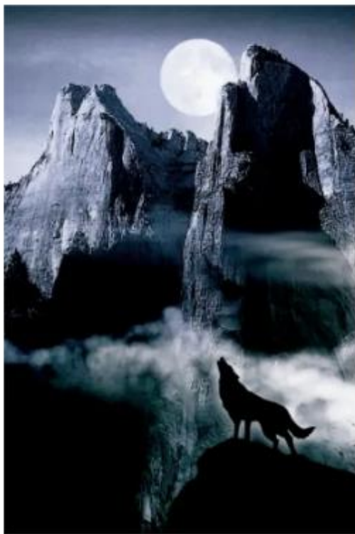
深沉骄傲的狼啸，从一个山崖回响到另一个山崖