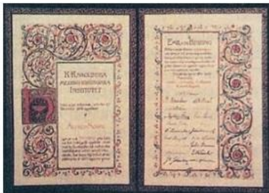
贝林的诺贝尔奖证书