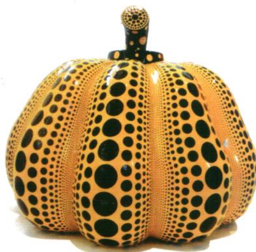
南瓜（雕塑） 草间弥生（日本）