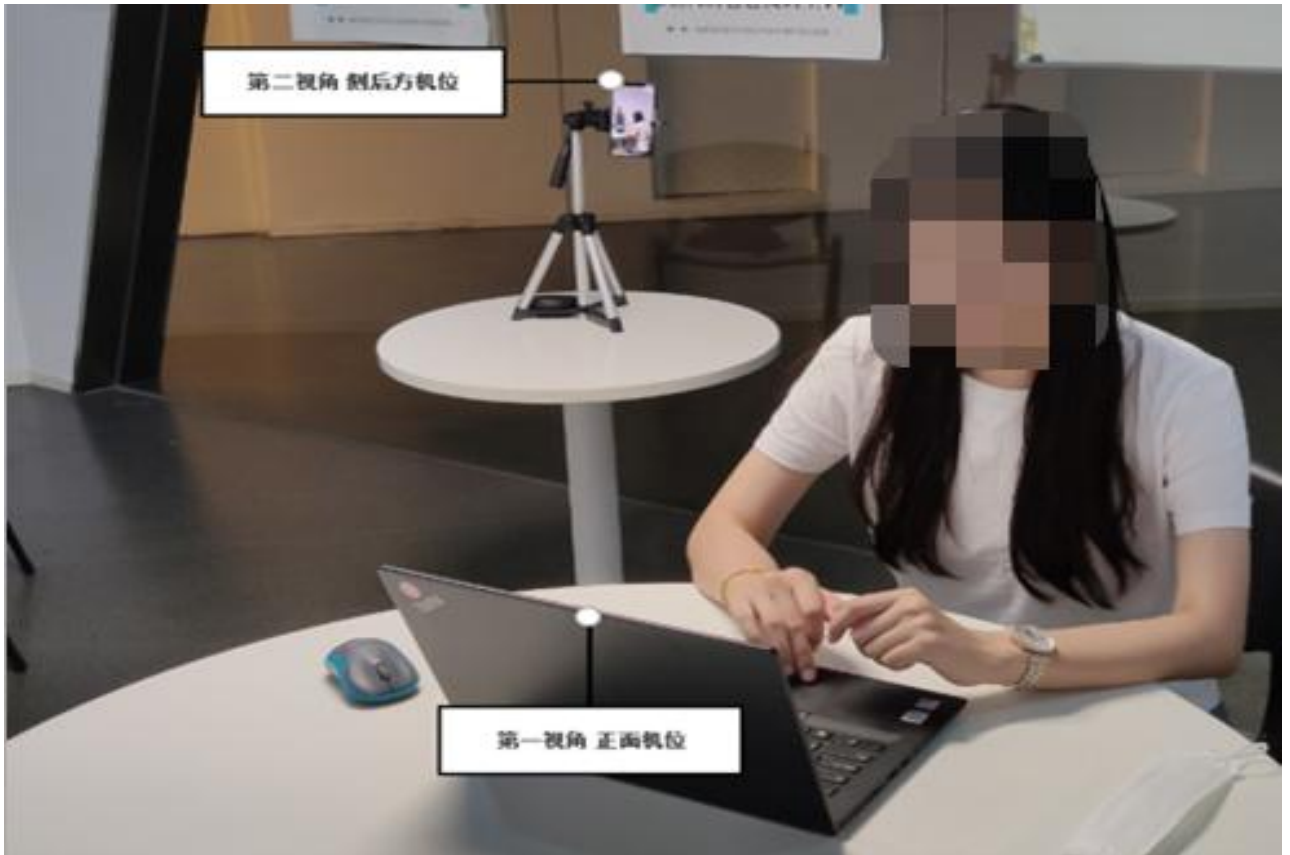
手机监控摆放示例