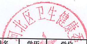
2023年天津市河北区卫生健康系统公开招聘事业单位工作人员笔试成绩名册