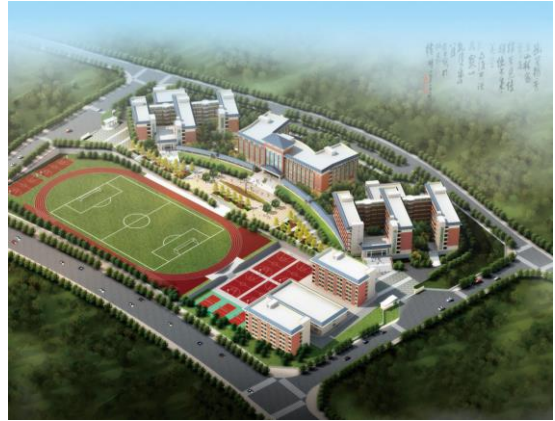
（图为学校全貌规划效果图）

郴州市增福中学创办于 2018 年，位于郴州市高铁片区，是一所九年一贯制公办学校，也是北湖实验学校教育集团的成员校。学校规划占地面积共 104 亩，已完成一期建设（占地面积 40 亩）。