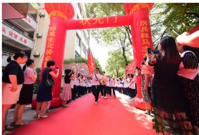
(图为初三学子百日誓师现场)

人，教师素质优良。近三年来，学校先后承担完成多项国家级、省级科研课题，40 余位教师获省、市教学比武一等奖，400 余篇教育教学论文获国家、省、市级荣誉。