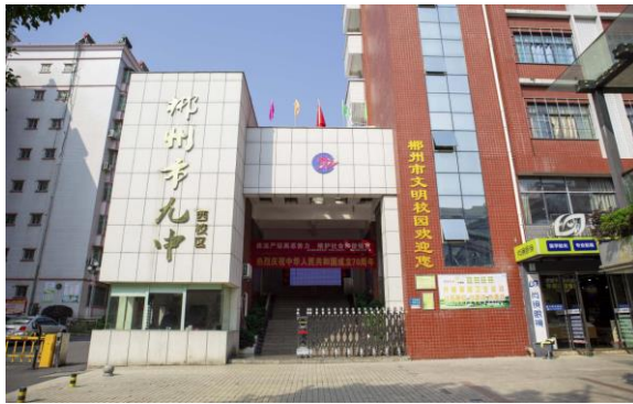
(郴州市第九中学西校区)

EPD项目实验学校”“全国教育科研重点项目重点实验学校”“全国青少年普法教育先进单位”“全国啦啦操实验学校”“湖南省绿色学校”“湖南省现代教育技术实验学校”等多项荣誉称号。