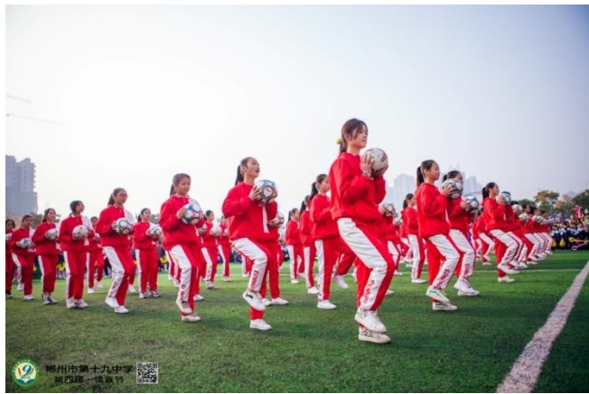
（图为学生足球啦啦操现场）

学校推行“经典传诵、多彩课堂、优秀+特长”的办学特色，每周一开展“美劳日”活动，每年开展“爱心义卖”“千家宴”“艺术节”“十四岁集体生日”“毕业感恩礼”