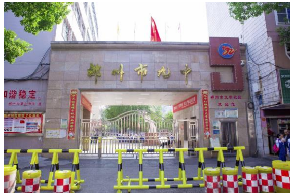
(图为郴州市第九中学东校区)

有103个教学班、5633名学生。校园环境幽雅，设施齐全，管理科学，教学质量优秀，特色鲜明，学校先后荣获“联合国教科文组织首批