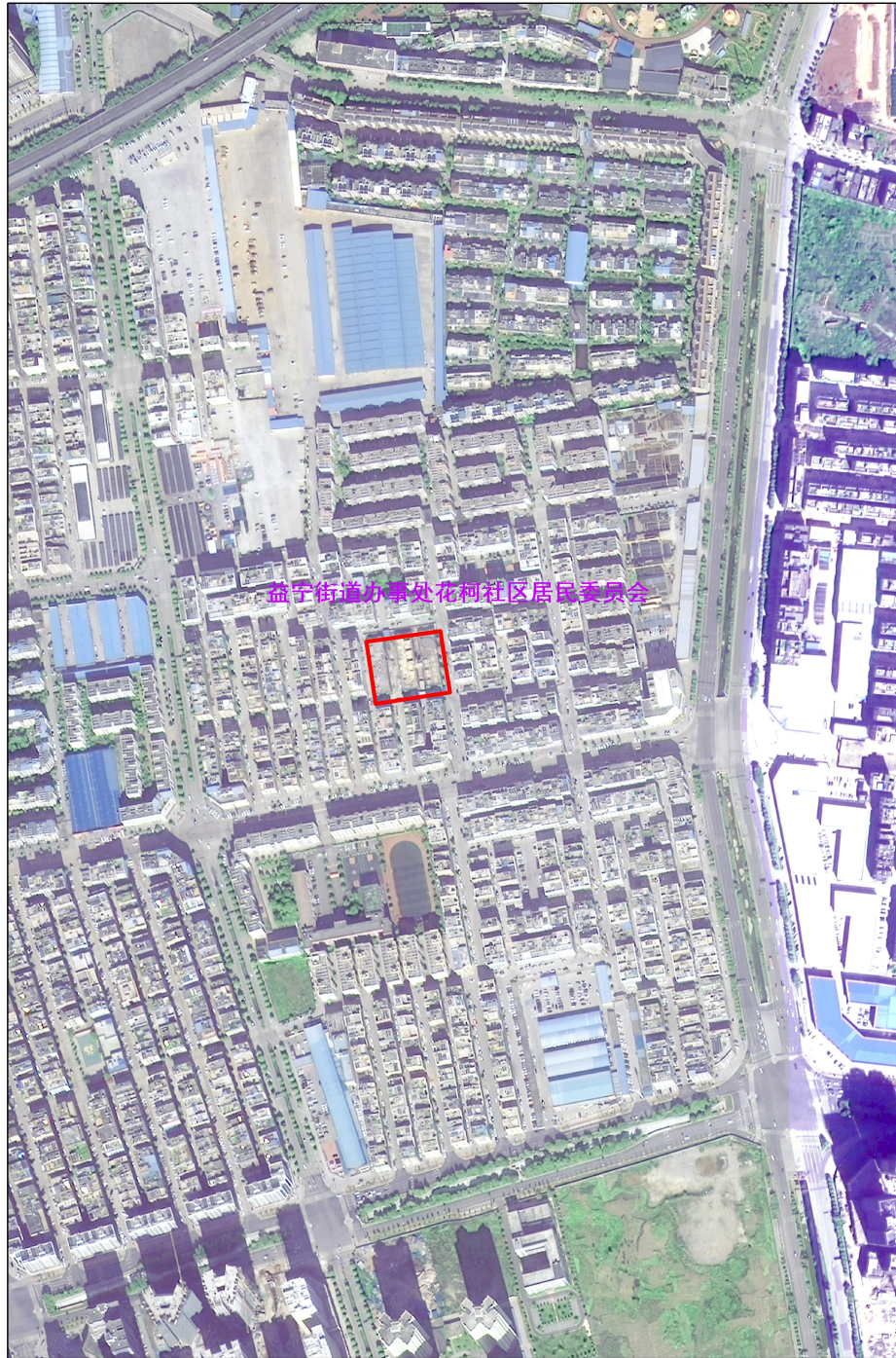
曲靖市麒麟区2023年度第十七批次城镇建设拟征收土地示意图