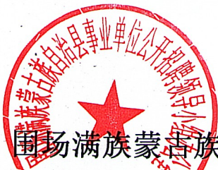
鄂伦春自治旗事业单位公开招聘成绩汇总表（上午）