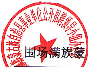
围场满族蒙古族自治县2022年事业单位公开招聘成绩汇总表（下午）