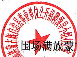
围场满族蒙古族自治县2022年事业单位公开招聘成绩汇总表（下午）