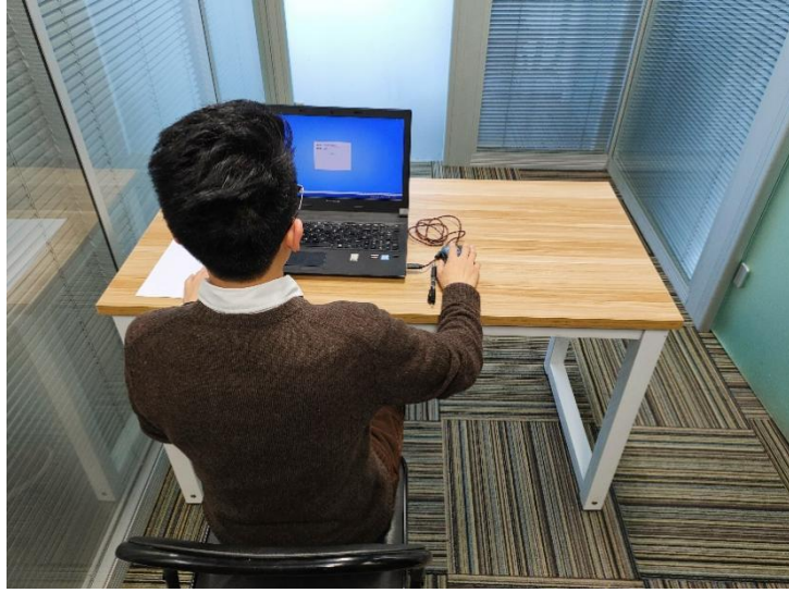
图二：电脑端背面视角