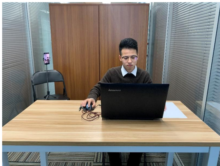
图一：电脑端正面视角

(4) 考试开始前，考生需要先登录移动端“智考通”，用前置摄像头 360 度环绕拍摄考试环境，随后将移动设备固定在能够拍摄到考生桌面、考生电脑屏幕内容、周围环境及考生行为的位置上继续拍摄（详见说明书中《智考通操作手册》《智考云在线考试规范》）。