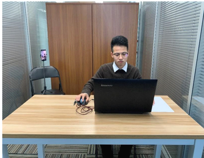
图一：电脑端正面视角

(八) 考试开始前，考生需要使用移动端“智试通”，开启作证录制并 360 度环绕拍摄考试环境，随后将移动设备固定在能够拍摄到考生桌面、考生电脑桌面、周围环境及考生行为的位置上继续拍摄（佐证拍摄范围如图一至图三）。电脑端和移动端摄像头全程开启拍摄考试过程。