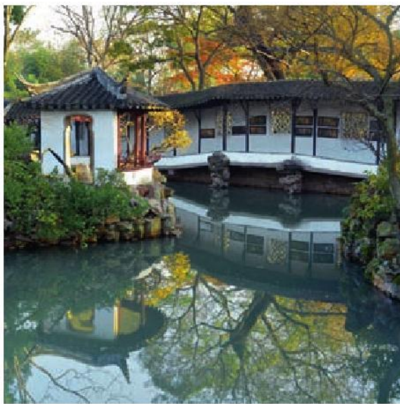
拙政园秋色

苏州园林栽种和修剪树木也着眼在画意。高树与低树俯仰生姿。落叶树与常绿树相间，花时不同的多种花树相间，这就一年四季不感到寂寞。没有修剪得像宝塔那样的松柏，没有阅兵式似的道旁树：因为依据中国画的审美观点看，