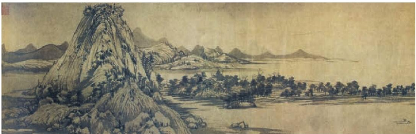
《富春山居图》(局部) [元]黄公望作

则百叫无绝。鸢飞戾天 ① 者，望峰息心 ② ；经纶世务 ③ 者，窥谷忘反 ④ 。横柯 ⑤ 上蔽，在昼犹昏；疏条交映 ⑥ ，有时见日。