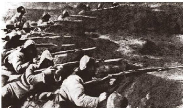
东北抗日队伍抗击日军