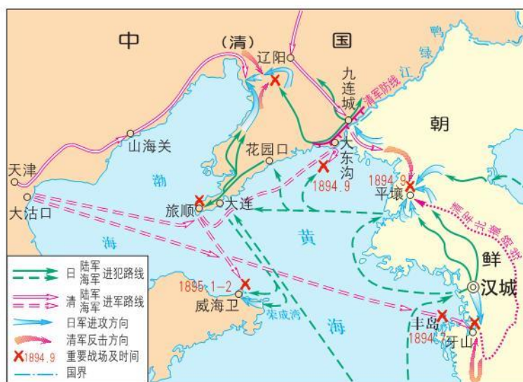
甲午中日战争形势图

北洋舰队与日本联合舰队在黄海海面也展开激战。北洋舰队将士在战斗中奋勇杀敌，重创日舰。致远舰管带邓世昌在舰身严重受损、弹药将尽之际，下令开足马力，冲向日舰“吉野号”，准备与敌人同归于尽，不幸被敌人炮弹击中，200余名将士壮烈殉国。此次海战，北洋舰队损失较大，但主力尚存。可惜战后李鸿章命令舰队躲进威海卫军港，不许出海迎敌，日军趁机夺取了制海权。