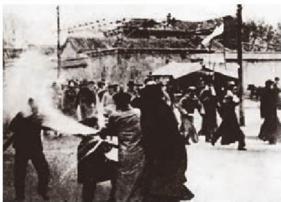
反动军警镇压北平爱国学生

严峻的形势使北平 ② 的学生们痛感“华北之大，已经安放不得一张平静的书桌了”。1935年12月9日，在中国共产党的领导下，北平数千名学生冒着严寒聚集在新华门前，向国民党当局请愿。他们高呼“打倒日本帝国主义”