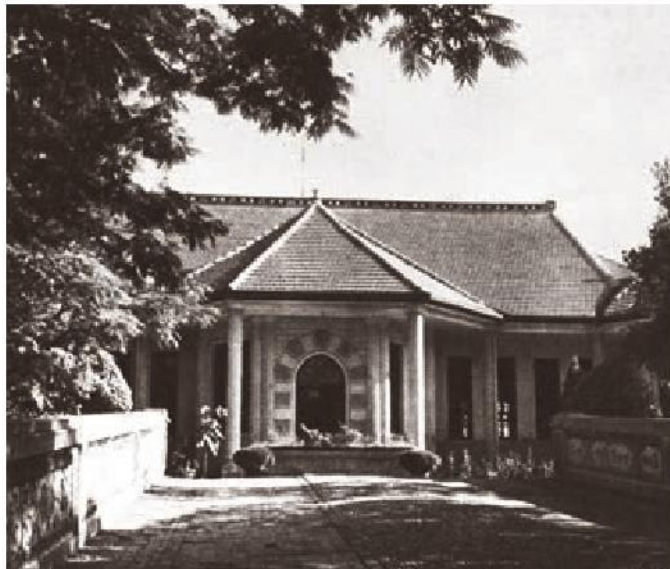
西安事变谈判旧址