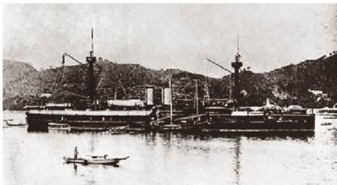
北洋舰队“定远号”铁甲舰

与此同时，中国的东南海疆也受到列强的严重威胁。在直隶总督李鸿章的倡议下，清政府开始大规模进行近代海防建设，筹建新式海军。到19世纪80年代，福建、广东、南洋和北洋等海军初步建成，其中以北洋舰队规模最大。1885年，清政府成立海军衙门统一协调指挥，同年还在台湾建立行省。