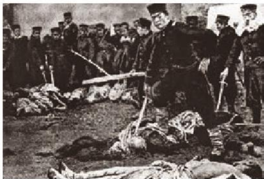
日军在旅顺屠杀中国居民

1895年初,日本陆海军进攻山东威海卫,北洋舰队陷入绝境。日本联合舰队司令写信给北洋水师提督丁汝昌,劝其率舰队投降,遭到严词拒绝。在援兵无望的情况下,丁汝昌自杀殉国。北洋舰队全军覆没。