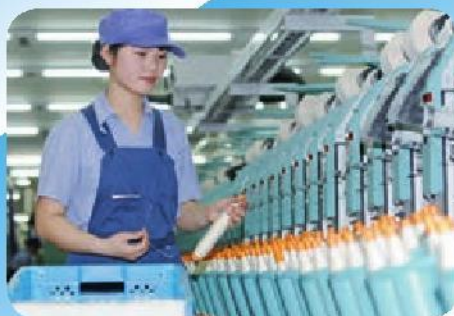
纺纱工人按操作规程工作