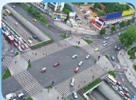
行人、自行车、机动车各行其道