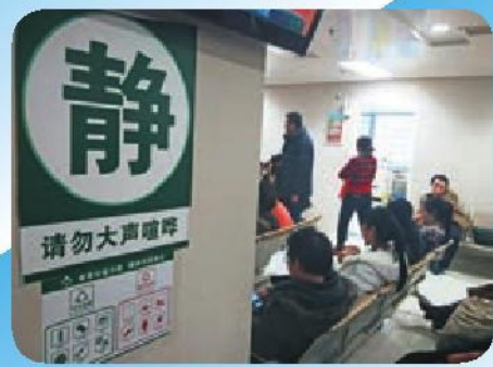
人们在公共场所保持安静