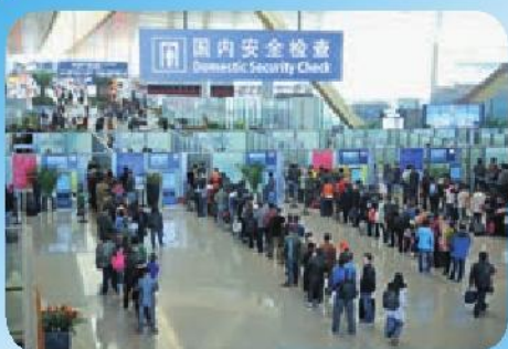
人们排队进行安全检查