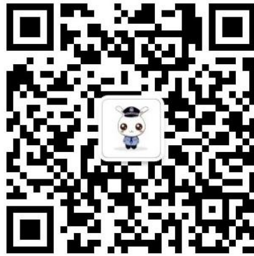
警校生小图公众号