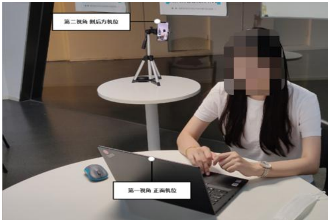
手机监控摆放示例