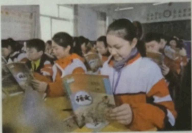
学生领到免费教科书

一些全国人大代表在不断深入基层调研的基础上，从2003年起陆续提交多项议案和建议，建议实行义务教育免费及义务教育教科书免费等。这些建议引起有关方面高度重视，政府先后出台了相关政策：2006年，免除西部地区农村义务教育阶段学生学杂费，2007年扩大到中部和东部地区；2007年，全国农村义务教育阶段教科书免费；2008年，全国城乡义务教育阶段学生全部免除学杂费；2017年，全国义务教育阶段教科书免费。