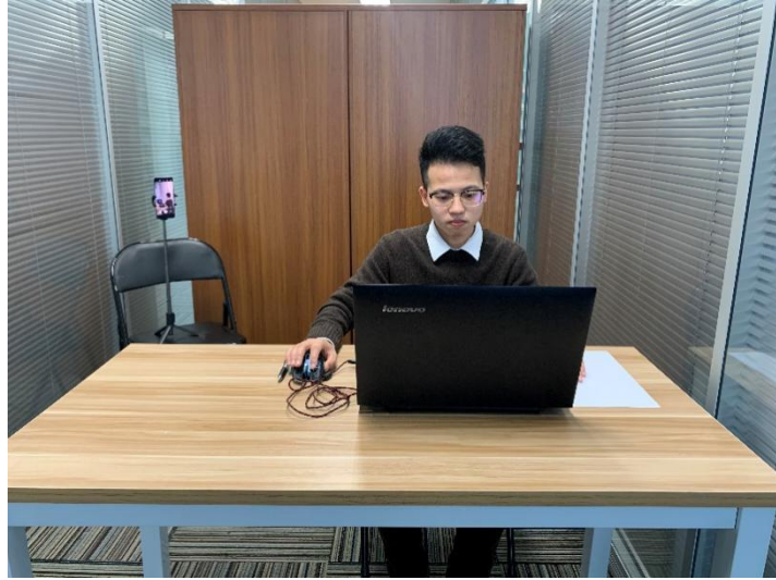
图一：电脑端正面视角