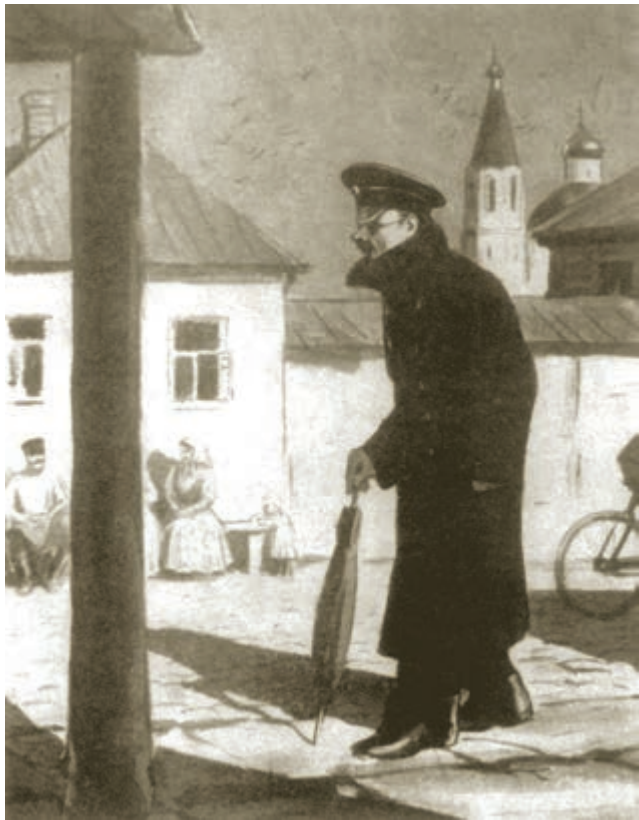
[苏联] 库克雷尼克塞 作

凡是违背法令、脱离常规、不合规矩的事，虽然看来跟他毫不相干，却惹得他闷闷不乐。要是他的一个同事到教堂参加祈祷式去迟了，或者要是他听到流言，说是中学的学生闹出了乱子，他总是心慌得很，一个劲儿地说：“千万别闹出什么乱子。”在教务会议上，他那种慎重，那种多疑，那种纯粹套子式的论调，简直压得我们透不出气。他说什么不管男子中学里也好，女子中学里也好，年轻人都不安分，教室里闹闹吵吵——唉，只求这种事别传到当局的耳朵里去才好，只求不出什么乱子才好。他认为如果把二年级的彼得洛夫和四年级的叶果洛夫开除，那才妥当。您猜怎么着？他凭他那种唉声叹气，他那种垂头丧气，