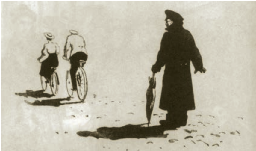
[苏联] 库克雷尼克塞 作

第二天他老是心神不定地搓手，打哆嗦，从他的脸色分明看得出来他病了。还没到放学的时候，他就走了，这在他还是生平第一回呢。他没吃午饭。将近傍晚，他穿得暖暖和和的，到柯瓦连科家里去了。华连卡不在家，就只碰到她弟弟。