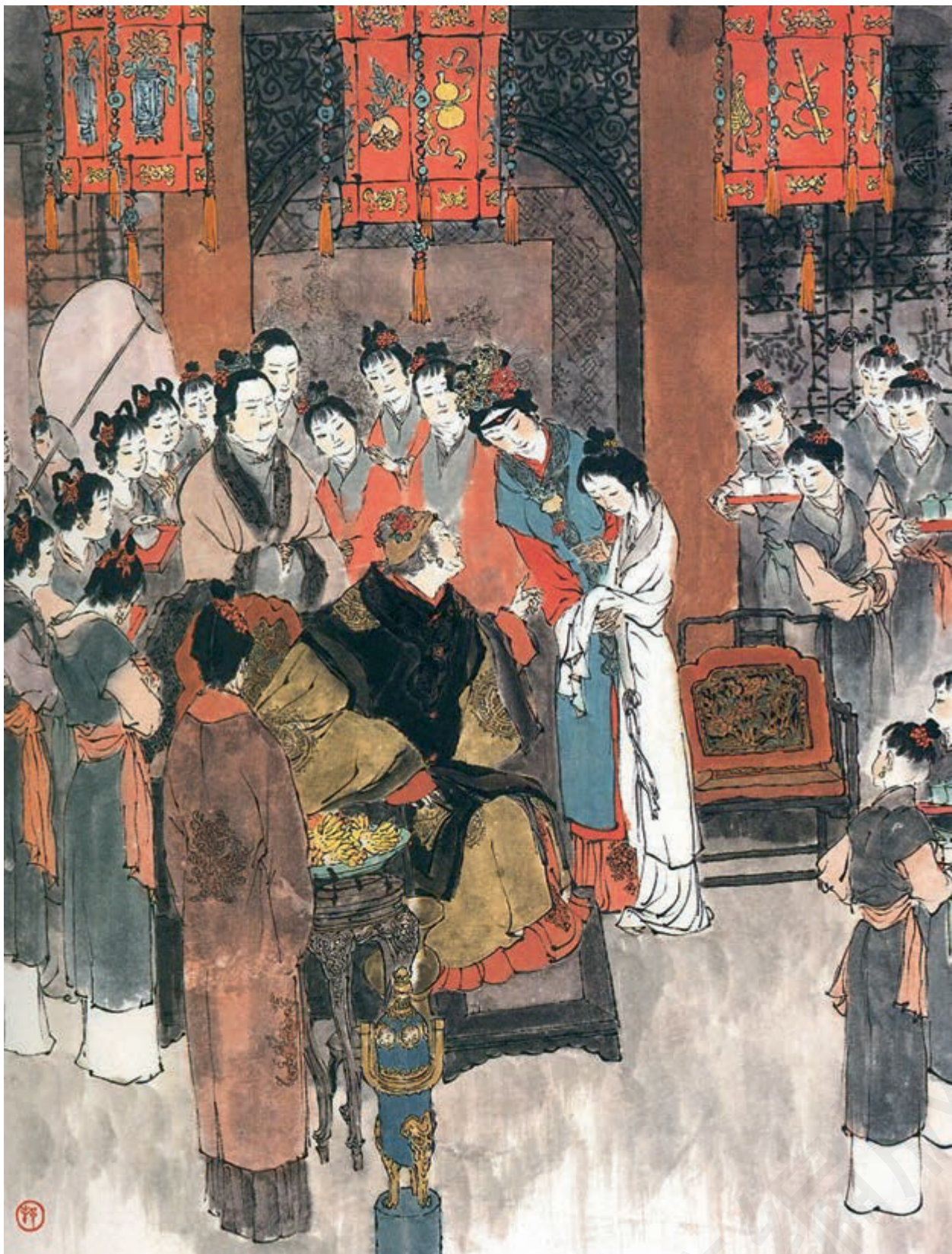
林黛玉进贾府 戴敦邦 作