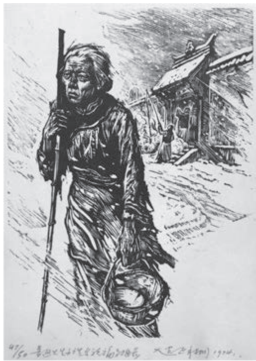
祥林嫂（木刻）赵延年作