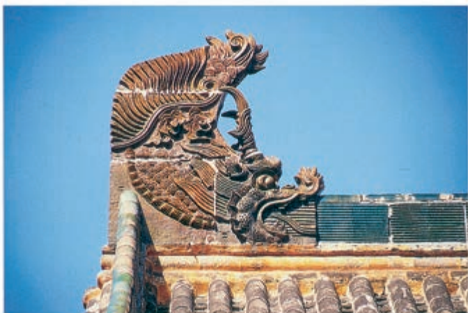
陕西韩城司马迁祠龙吻

这一切特点都有一定的风格和手法，为匠师们所遵守，为人民所承认，我们可以叫它作中国建筑的“文法”。建筑和语言文字一样，一个民族总是创造出他们世代所喜爱，因而沿用的惯例，成了法式。在西方，希腊、罗马体系创造了它们的“五种典范 ① ”，成为它们建筑的方式。中国建筑怎样砍割并组织木材成为梁架，成为斗拱，成为一“间”，成为个别建筑物的框架；怎样用举架的公式求得屋顶的曲面和曲线轮廓；怎样结束 ② 瓦顶；怎样求得台基、台阶、栏杆的比例；怎样切削生硬的结构部分，使之同时成为柔和