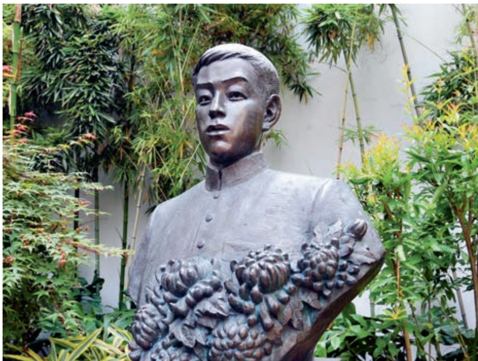
福州林觉民故居的林觉民烈士塑像