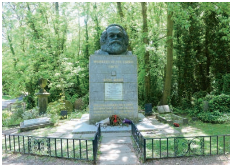
位于英国伦敦海格特公墓的马克思墓

因为马克思首先是一个革命家。他毕生的真正使命，就是以这种或那种方式参加推翻资本主义社会及其所建立的国家设施的事业，参加现代无产阶级的解放事业，正是他第一次使现代无产阶级意识到自身的地位和需要，意识到自身解放的条件。斗争是他的生命要素。很少有人像他那样满腔热情、坚韧不拔和卓有成效地进行斗争。最早的《莱茵报》 ② （1842年），巴黎的《前进报》 ③ （1844年），《德意志-布鲁塞尔报》 ④ （1847年），《新莱茵报》 ⑤ （1848—1849年），《纽约每日论坛报》 ⑥ （1852—1861年），以及许多富有战斗性的小册子，在巴黎、布鲁塞尔和伦敦各组织中的工作，最后，作为全部活动的顶峰，创立伟大的国际工人协会 ⑦ ，——老实说，协会的这位创始人即使没有别的什么建树，单凭这一成果也可以自豪。