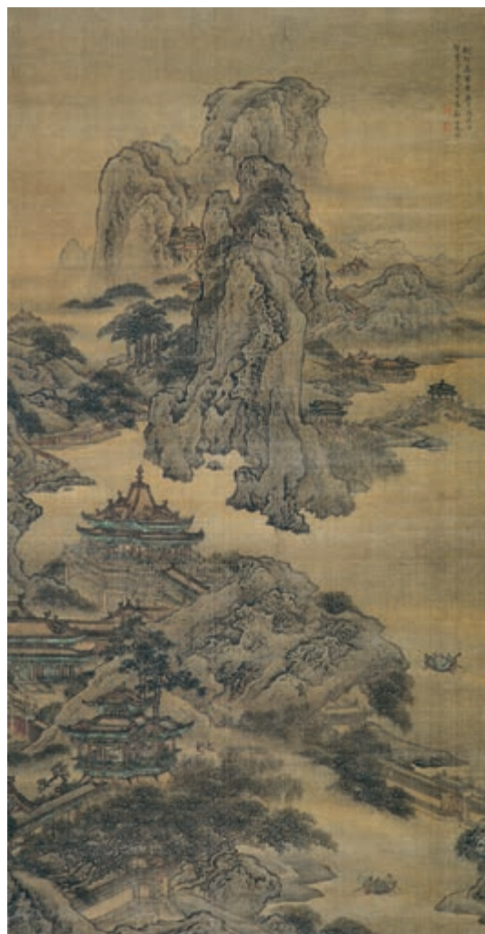
阿房宫图 [清]袁耀 作

呜呼！灭六国者六国也，非秦也；族 ⑳ 秦者秦也，非天下也。嗟乎！使六国各爱其人，则足以拒秦；使秦复爱六国之人，则递 ㉑ 三世可至万世而为君，谁得而族灭也？秦人不暇自哀，而后人哀之；后人哀之而不鉴之，亦使后人而复哀后人也。