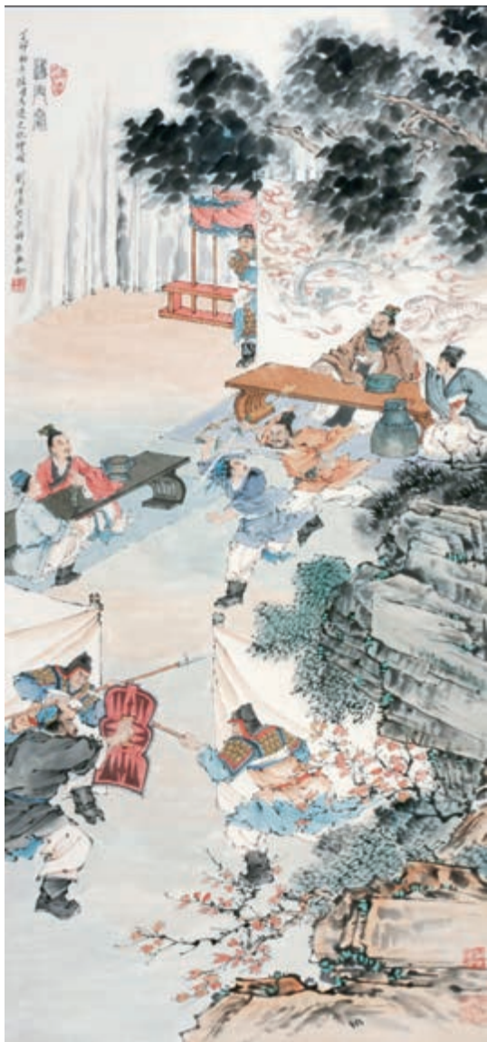
鸿门宴 刘凌沧 作

于是张良至军门见樊哙 ② 。樊哙曰：“今日之事何如？”良曰：“甚急！今者项庄拔剑舞，其意常在沛公也。”哙曰：“此迫矣！臣请入，与之同命 ③ 。”哙即带剑拥盾入军门。交戟之卫士 ④ 欲止不内。樊哙侧其盾以撞，卫士仆地。哙遂入，披帷 ⑤ 西向立，瞋目视项王，头发上指，目眦 ⑥ 尽裂。项王按剑而跽 ⑦ 曰：“客何为者？”张良曰：“沛公之参乘 ⑧ 樊哙者也。”项王曰：“壮士！赐之卮酒。”则与斗卮 ⑨ 酒。哙拜谢，起，立而饮之。项王曰：“赐之彘肩 ⑩ 。”则与一生彘肩。樊哙覆其盾于地，加彘肩上 ⑪ ，拔剑切而啖 ⑫ 之。项王曰：“壮士！能复饮乎？”樊哙曰：“臣死且不避，卮酒安足辞！夫秦王有虎狼之心，杀人如不能举，刑人如恐不胜 ⑬ ，天下皆叛之。怀王 ⑭ 与诸将约曰：‘先破秦入咸阳者王之。’今沛公先破秦入咸阳，毫毛不敢有所近，封闭宫室，还军霸上，以待大王来。故遣将守关者，备他盗出人与非常也。劳苦而功高如此，未有封侯之赏，而听细说 ⑮ ，欲诛有功之人，此亡秦之续 ⑯ 耳。窃为大王不取也 ⑰ ！”项王未有以应，曰：“坐。”樊哙从良坐。坐须臾，沛公起如厕，因招樊哙出。