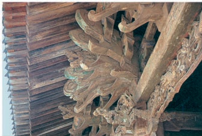
山西解州关帝庙春秋楼象鼻昂

(八) 在木结构建筑中, 所有构件交接的部分都大半露出, 在它们外表形状上稍稍加工, 使成为建筑本身的装饰部分。例如: 梁头做成“桃尖梁头 ③ ”或“蚂蚱头 ④ ”; 额枋出头做成“霸王拳”; 昂 ⑤ 的下端做成“昂嘴”, 上端做成“六分头”或“菊花头”; 将几层昂的上段固定在一起的横木做成