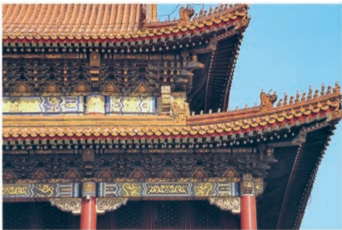
北京天安门城楼斗拱

两柱之间也常用墙壁，但墙壁并不负重，只是像“帷幕”一样，用以隔断内外，或划分内部空间而已。因此，门窗的位置和处理都极自由，由全部用墙壁至全部开门窗，乃至既没有墙壁也没有门窗（如凉亭），都不妨碍负重的问题；房顶或上层楼板的重量总是由柱承担的。这种框架结构的原则直到现代的钢筋混凝土构架或钢骨架的结构才被应用，而我们中国建筑在3000多年前就具备了这个优点，并且恰好为中国将来的新建筑在使用新的材料与技术的问题上准备了极有利的条件。