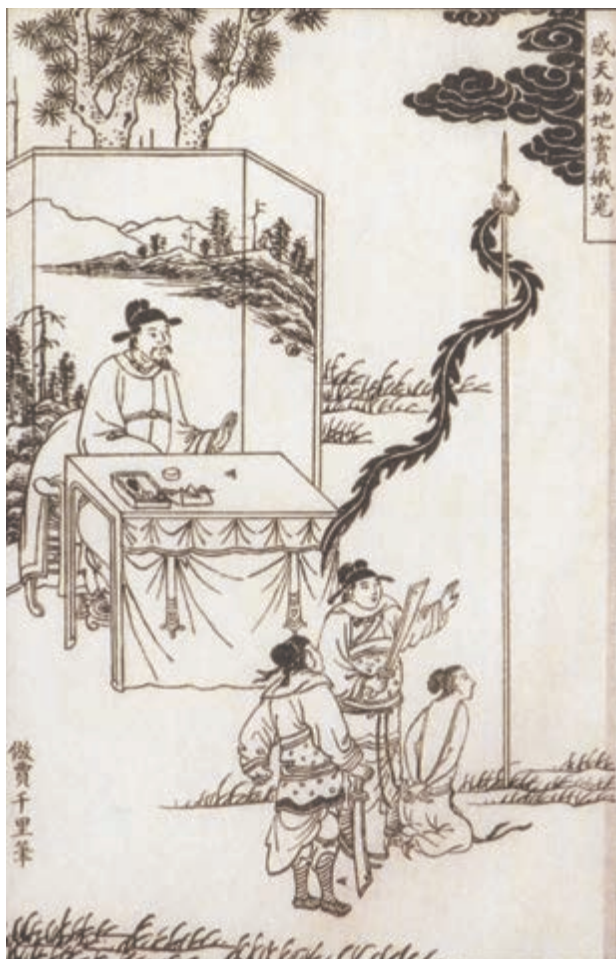
法场上发誓愿（明代版画）