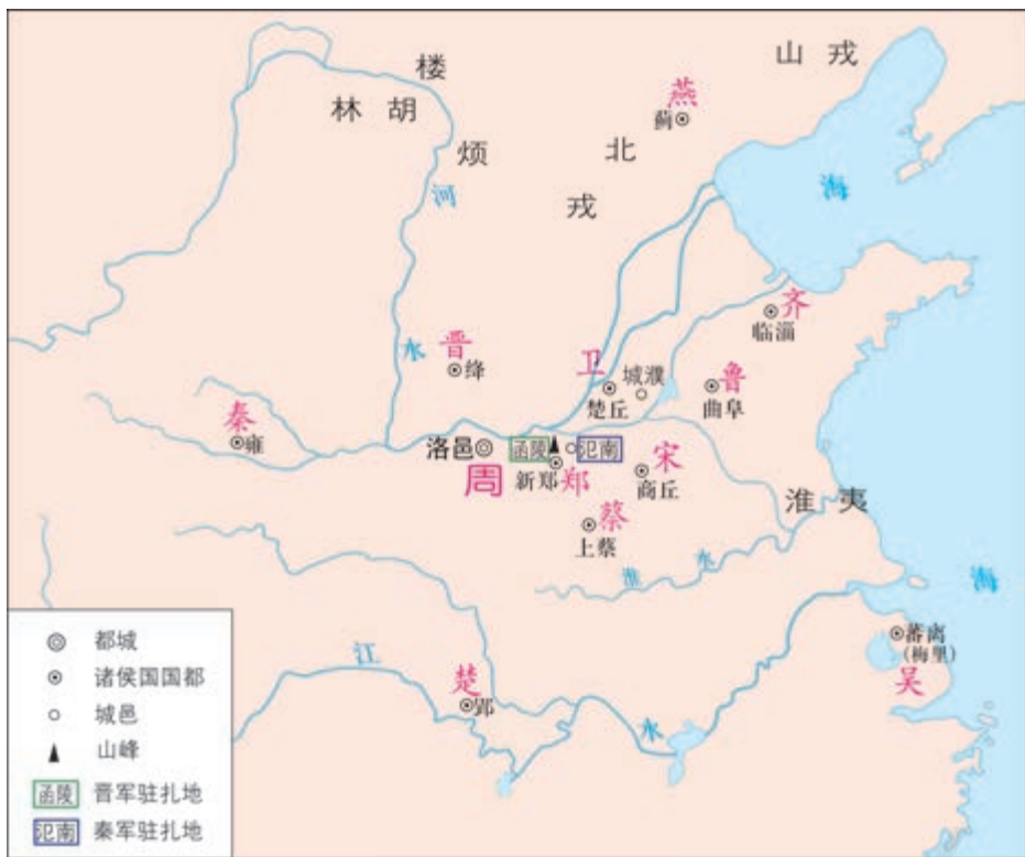
春秋列国形势简图（前630年）

佚之狐 ⑦ 言于郑伯 ⑧ 曰：“国危矣，若使烛之武见秦君，师必退。”公从之。辞曰：“臣之壮 ⑨ 也，犹 ⑩ 不如人；今老矣，无能为也已 ⑪ 。”公曰：“吾不能早用子，今急而求子，是寡人之过也。然郑亡，子亦有不利焉。”许 ⑫ 之。