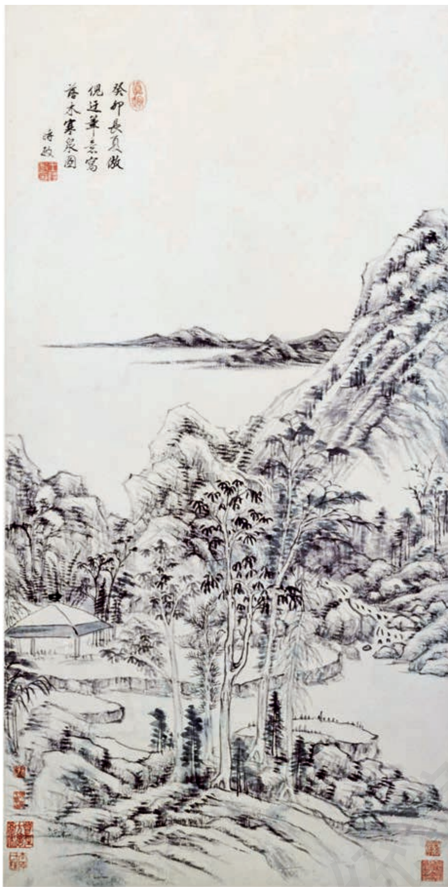
落木寒泉图 [清]王时敏 作