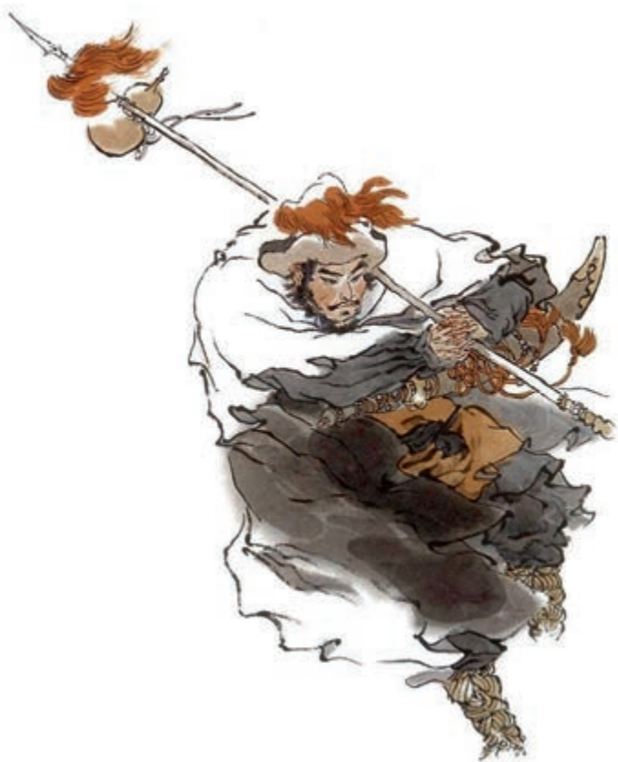
豹子头林冲 戴敦邦 作

再说林冲踏着那瑞雪，迎着北风，飞也似奔到草场门口，开了锁，入内看时，只叫得苦。原来天理昭然，佑护善人义士，因这场大雪，救了林冲的性命：那两间草厅已被雪压倒了。林冲寻思：“怎地好？”放下花枪、葫芦在雪里；恐怕火盆内有火炭延烧起来，搬开破壁子，探半身入去摸时，火盆内火种都被雪水浸灭了。林冲把手床上摸时，只拽得一条絮被。林冲钻将出来，见天色黑了，寻思：“又没打火处，怎生安排？”想起离了这半里路上有个古庙，可以安身：“我且去那里宿一夜，等到天明，却作理会。”把被卷了，花枪挑着酒葫芦，依旧把门拽上，锁了，望那庙里来。入得庙门，再把门掩上。旁边止有一块大石头，拨将过来靠了门。入得里面看时，殿上塑着一尊金甲山神，两边一个判官，一个小鬼，侧边