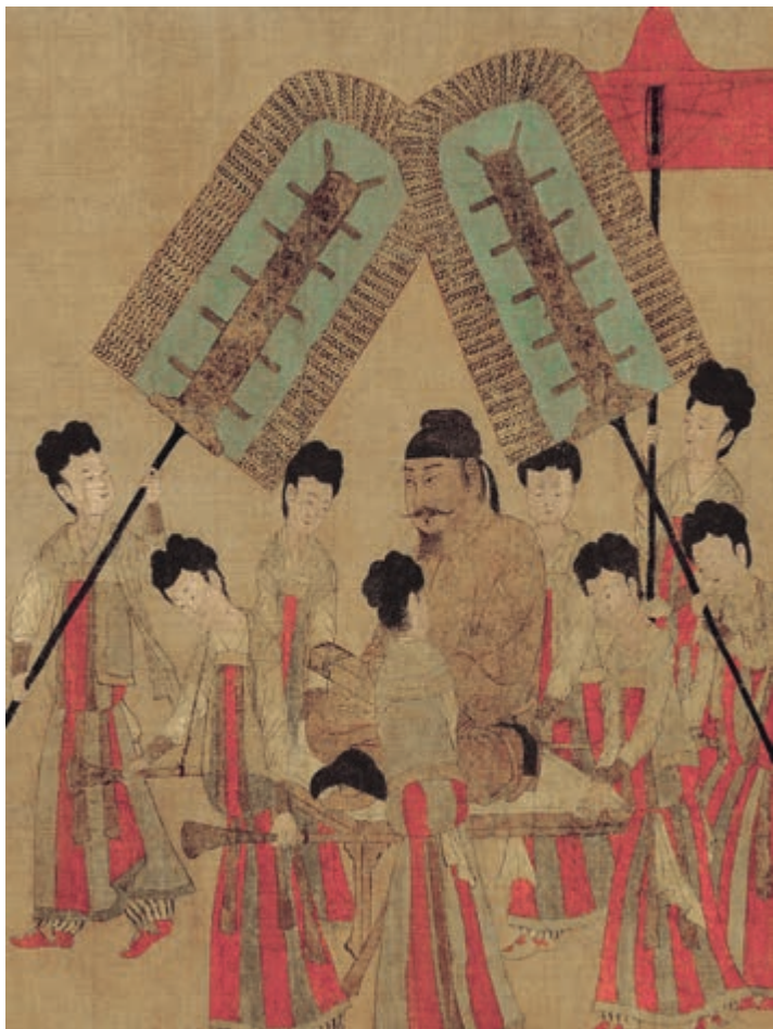
步辇图（局部）[唐]阎立本 作

君人者，诚能见可欲 ① 则思知足以自戒，将有作 ② 则思知止以安人，念高危则思谦冲而自牧 ③ ，惧满溢 ④ 则思江海下百川 ⑤ ，乐盘游 ⑥ 则思三驱 ⑦ 以为度，忧懈怠则思慎始而敬 ⑧ 终，虑壅蔽 ⑨ 则思虚心以纳下，想谗邪 ⑩ 则思正身以黜恶，恩所加则思无因喜以谬赏 ⑪ ，罚所及则思无因怒而滥刑。总此十思，弘兹九德 ⑫ ，简能而任之，择善而从之，则智者尽其谋，勇者竭其力，仁者播其惠 ⑬ ，信者 ⑭ 效其忠。文武争驰，在君无事，可以尽豫游 ⑮ 之乐，可以养松、乔之寿 ⑯ ，鸣琴垂拱 ⑰ ，不言而化。何必劳神苦思，代下司职，役聪明之耳目，亏无为之大道哉！