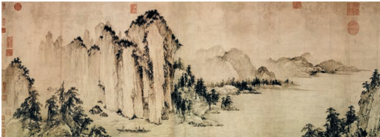
赤壁图 [金] 武元直 作

苏子曰：“客亦知夫水与月乎？逝者如斯，而未尝往也；盈虚者如彼，而卒莫消长也 ㉑ 。盖将自其变者而观之，则天地曾不能以