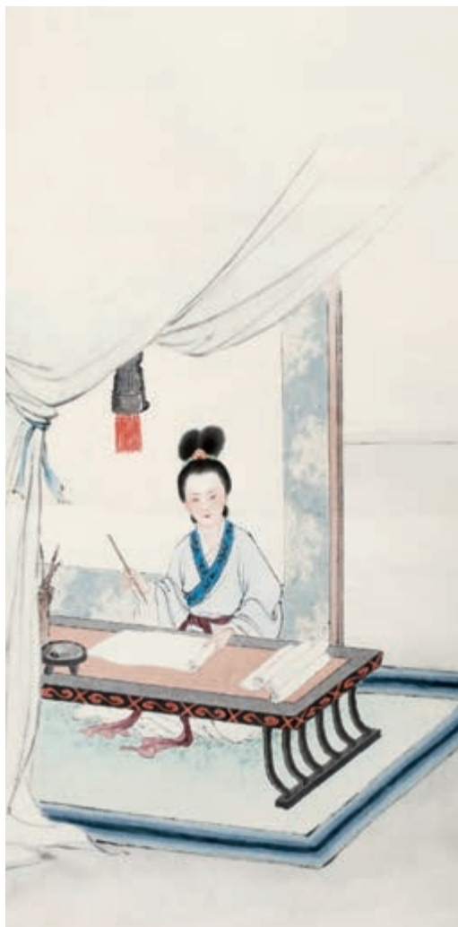
李清照像 郑慕康 作

寻寻觅觅，冷冷清清，凄凄惨惨戚戚 ② 。乍暖还寒 ③ 时候，最难将息 ④ 。三杯两盏淡酒，怎敌他、晚来风急！雁过也，正伤心，却是旧时相识。满地黄花 ⑤ 堆积，憔悴损 ⑥ ，如今有谁堪 ⑦ 摘？守着窗儿，独自怎生得黑 ⑧ ！梧桐更兼细雨，到黄昏、点点滴滴。这次第 ⑨ ，怎一个愁字了得 ⑩ ！