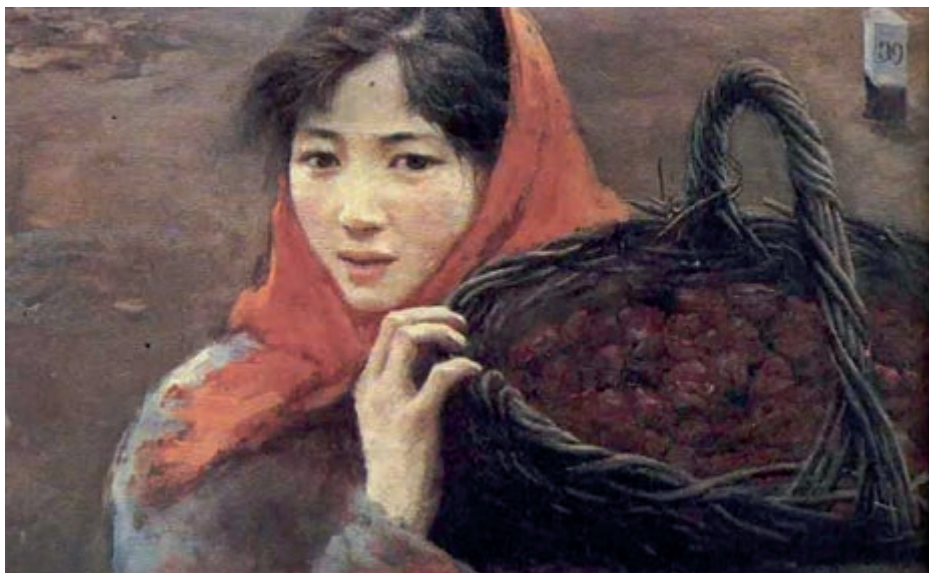
《哦，香雪》连环画 王玉琦 作

有时她也抓空儿向他们打听外面的事，打听北京的大学要不要台儿沟人，打听什么叫“配乐诗朗诵”（那是她偶然在同桌的一本书上看到的）。有一回她向一位戴眼镜的中年妇女打听能自动开关的铅笔盒，还问到它的价钱。谁知没等人家回话，车已经开动了。她追着它跑了好远，当秋风和车轮的呼啸一同在她耳边鸣响时，她才停下脚步意识到，自己的行为是多么可笑啊。