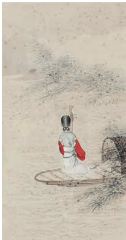
琵琶行 [清]改琦 作

沉吟放拨插弦中，整顿衣裳起敛容 ⑰ 。自言本是京城女，家在虾蟆陵 ⑱ 下住。十三学得琵琶成，名属教坊 ⑲ 第一部 ⑳ 。曲罢曾教善才服，妆成每被秋娘 ㉑ 妒。五陵年少 ㉒ 争缠头 ㉓ ，一曲红绡 ㉔ 不知数。钿头银篦 ㉕ 击节碎 ㉖ ，血色罗裙翻酒污 ㉗ 。今年欢笑复明年，秋月春风等闲 ㉘ 度。弟走从军阿姨死，暮去朝来颜色故 ㉙ 。门前冷落鞍马稀，老大 ㉚ 嫁作商人妇。商人重利轻别离，前月浮梁 ㉛ 买茶去。去来 ㉜ 江口守空船，绕船月明江水寒。