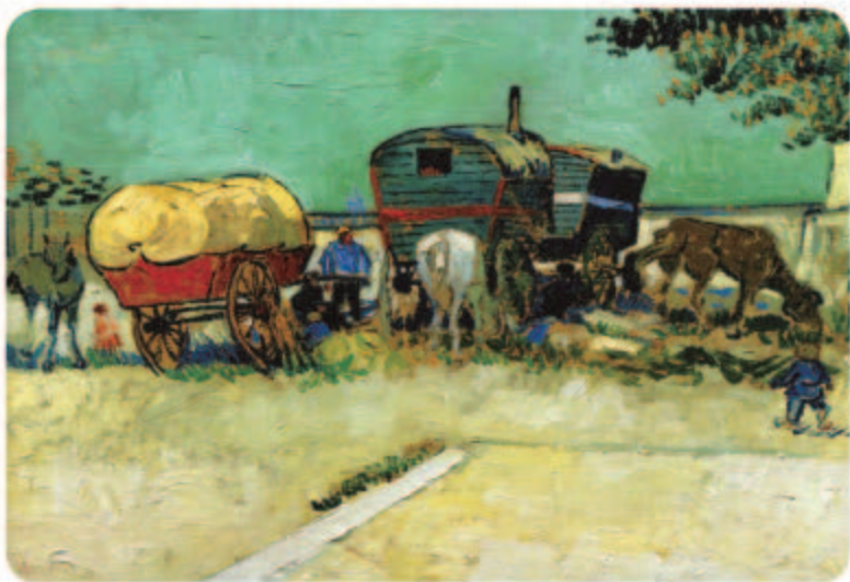
吉普赛人的大篷车 〔荷〕凡·高