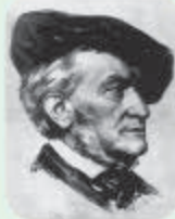
Wilhelm Richard Wagner 瓦格纳（1813—1883）

德国作曲家、指挥家。一生致力于歌剧的改革与创作，推动了浪漫主义歌剧的发展。代表作品有《罗恩格林》《纽伦堡的名歌手》《尼伯龙根的指环》等。