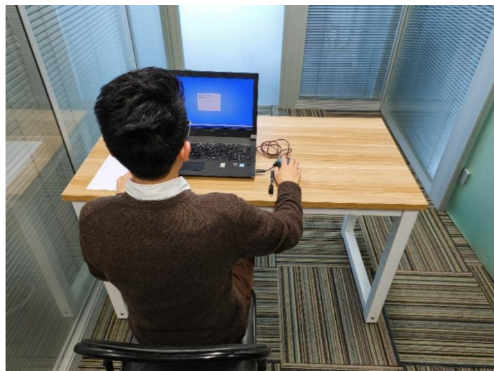
图二：电脑端背面视角