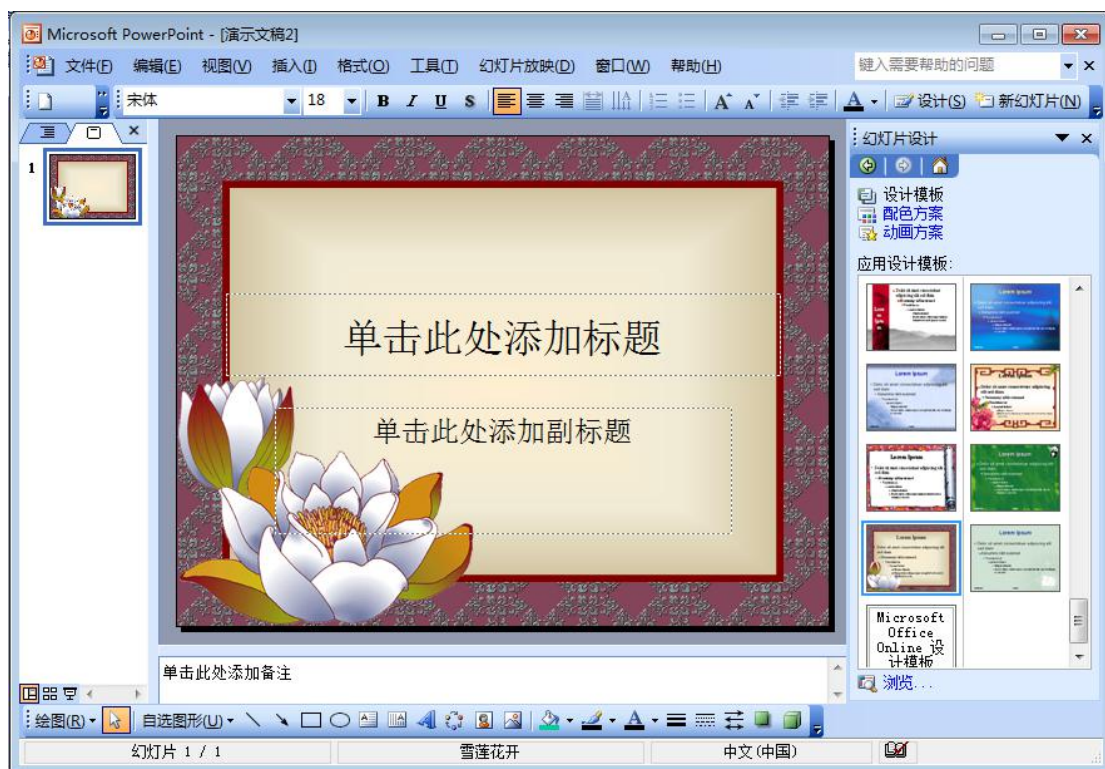
图 2 雪莲花开模板