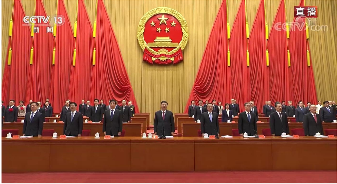
全国脱贫攻坚楷模荣誉称号获得者（10 个人+10 个集体）