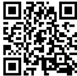
2022 云南省考彩云公考 4.0