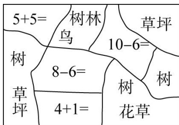
图1 尚未完成的拼图

教师为了帮助大班的幼儿了解春天的季节特征，同时在其中渗透数学教育，专门制作了一套“春天”的拼图（如图1）。拼图底板是若干道10以内计算题，每一小块图形的正面是春天景色的一部分，背面是计算题的得数（如图2），教师希望幼儿根据计算题与得数的匹配找到拼图的相应位置。然而，材料投放后，教师却发现许多幼儿不用做计算题就能轻松完成拼图，也未对图片中的季节特征产生观察与探究的兴趣。