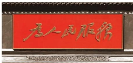
中南海新华门影壁上刻着的“为人民服务”

坚持为人民服务的工作态度。政府及其工作人员要牢固树立为人民服务、真心实意对人民负责的思想，为人民谋利益。政府工作人员在执行公务过程中，必须深入群众，关注民生，体察民情，尊重民意；不能损害人民利益，违法失职行为要受到追究。