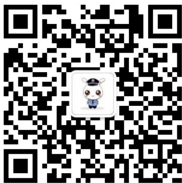
警校生小图公众号

【解析】本题考查行文规则。处于领导、指导地位的上级机关可以向被领导、被指导下级机关主送下行文；被领导、被指导下级机关向上级领导、指导机关主送上行文；具有平行关系或其他不相隶属关系的机关之间相互主送平行文。故党政机关的行文关系有上行文、下行文、平行文。故本题选择 B。