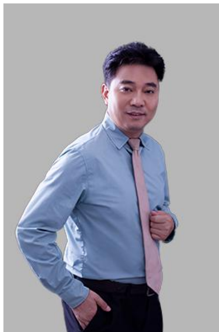
金红斌 从政 30 年，曾任正处级领导