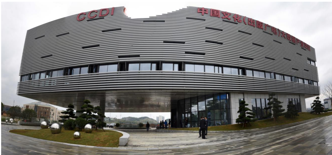
中国文化（出版广电）大数据产业项目基地（简称： CCDI）实景图