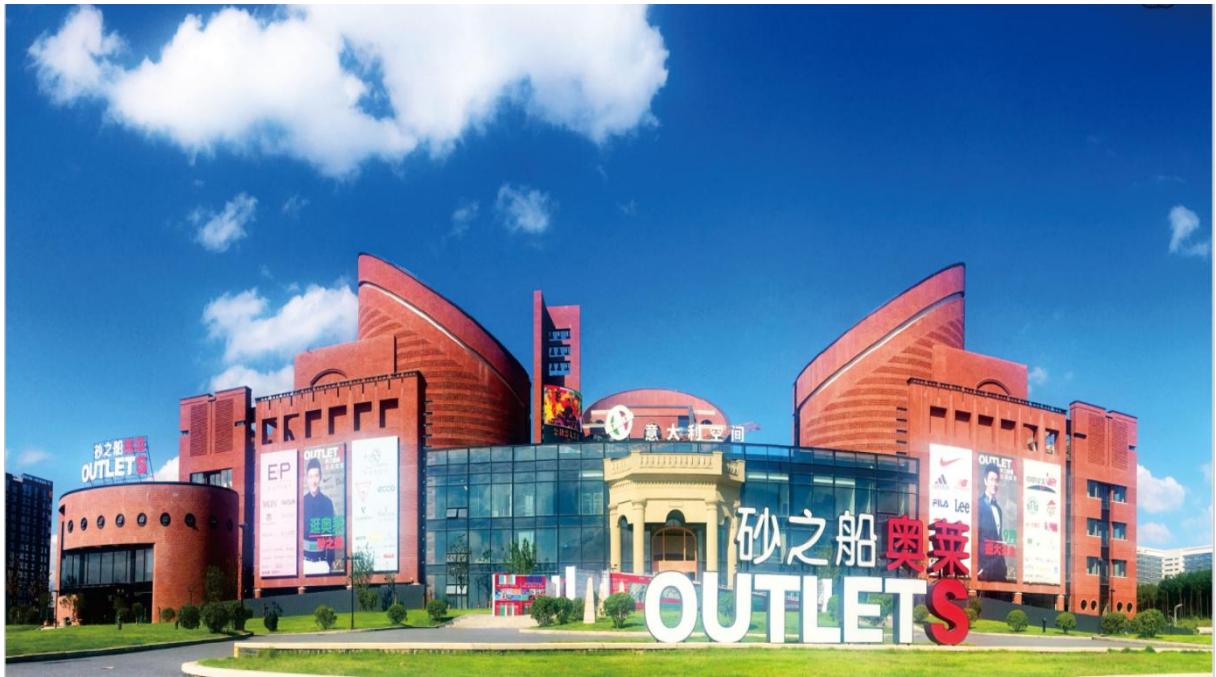
砂之船·奥特莱斯实景图