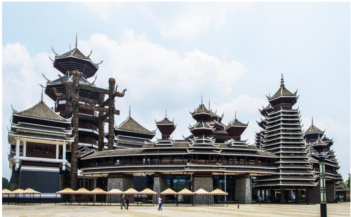
多彩贵州城实景图