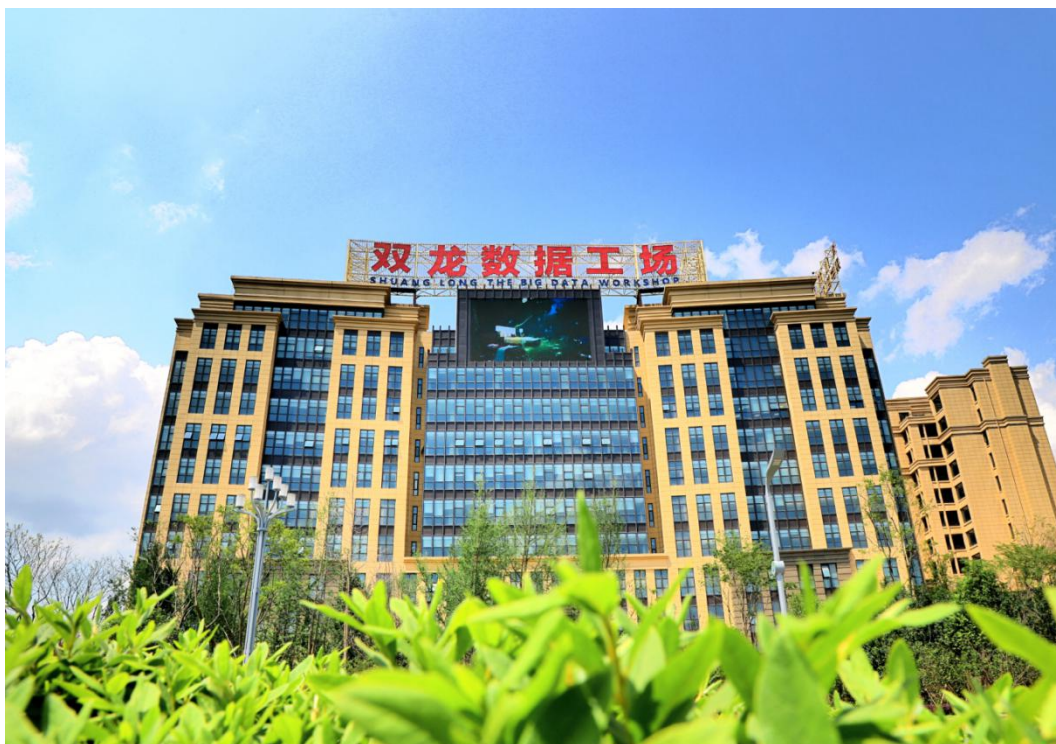
贵州双龙航空港经济区数据工场