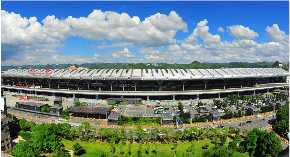
龙洞堡国际机场实景图