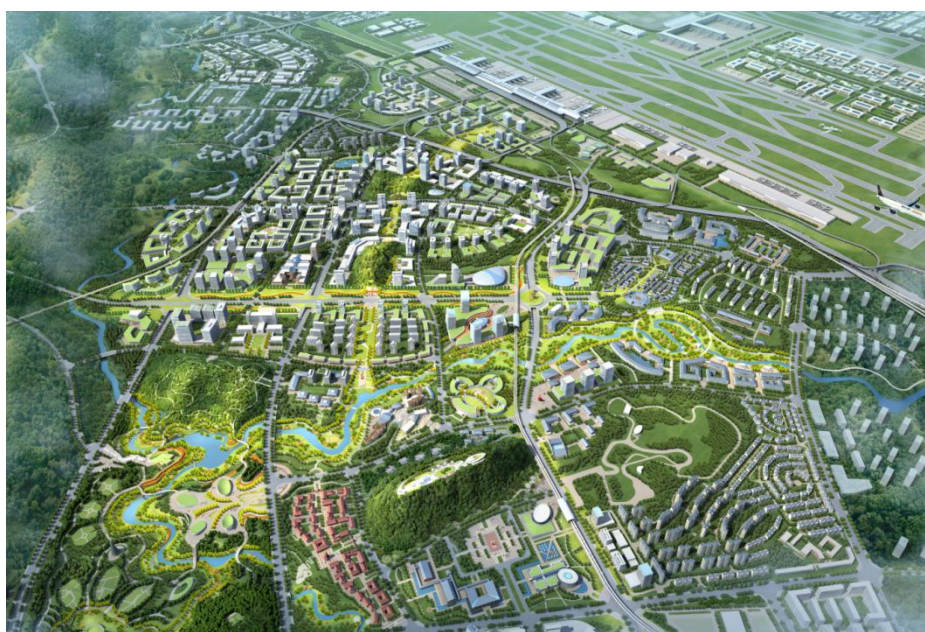
贵州双龙航空港经济区总体规划效果图

贵州双龙航空港经济区成立于2014年10月,是贵州省“1+8”国家级开放创新平台之一,2017年获批国家级临空经济示范区。经济区规划面积148平方公里,2030年规划人口50万人,是贵州省对外开放的重要门户和改革开放的先行区。经济区依托龙洞堡国际机场,区位优势明显,交通快捷方便,生态环境优良,资源要素集聚,基础条件优越,发展空间广阔,是一个宜业、宜聚、宜居的港产城融合发展新区。