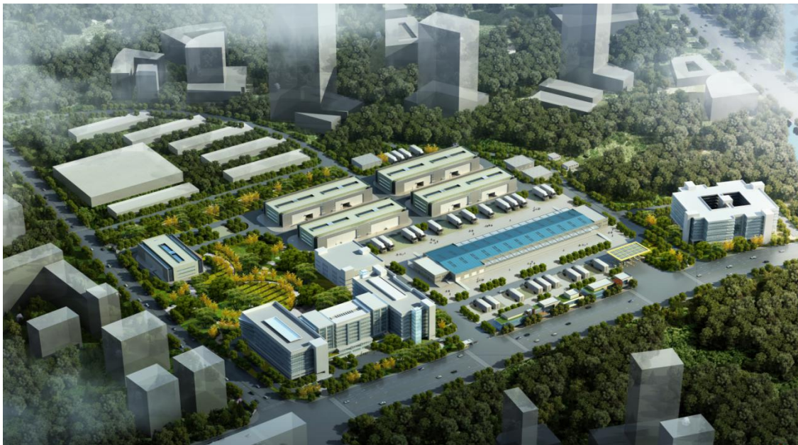
国检试验区效果图