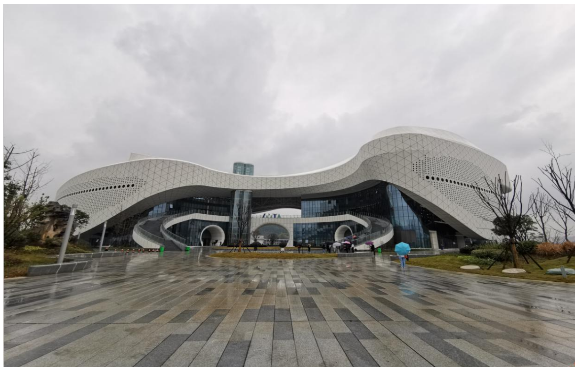
国际山地旅游联盟总部实景图

982 家。其中：世界 500 强企业 16 家；航空及航空关联服务企业近 200 家、总部企业 29 户；工业企业共 222 家；商贸物流业 423 家；大数据企业超过 200 家；会展及文旅企业 22 家。宝能新能源汽车、中电新能源汽车、宝能科技城、国检试验区、正威集团、中国文化（出版广电）大数据产业项目基地（CCDI）、贵州数联铭品科技有限公司（BBD）、砂之船·奥特莱斯、多彩贵州海洋馆、中国联通双创中心、顺丰速运、菜鸟物流、宝能物流、茅台智慧物流等国内外知名企业成功入驻经济区。