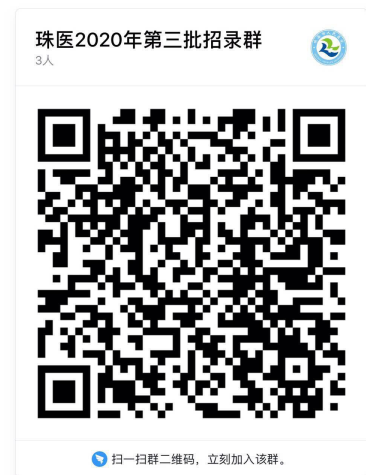
(用钉钉扫一扫“二维码”加入钉钉群)