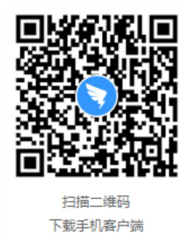
(钉钉 APP 手机客户端二维码)