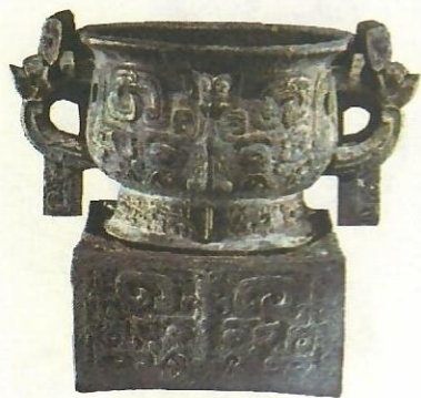
利簋 ② 及铭文