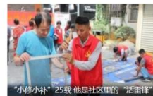
“小修小补”25载 他居社区里的“活雷锋”

《工作方案》明确了五项重点任务， 一是充分发挥课堂教学主渠道作用，推动爱国主义教育进课堂进头脑。 要推进思政改革创新，有机融入爱国主义故事、战“疫”故事、先进典型事迹以及形势与政策要闻等鲜活素材，不断增强思政课程的思想性、理论性和亲和力、针对性，挖掘各学科育人资源，统筹地方和校本课程，构建爱国主义教育和知识体系教育相统一的育人机制。二是不断丰富德育活动的形式内容，激发爱国主义真挚情感。要丰富德育活动内涵，组织开展以“我和我的祖国”为主题的爱国主义教育活动，发挥仪式教育作用，注重节庆纪念日教育，发挥团队组织教育功能，激发情感共鸣，强化国家意识和集体观念，增进民族自豪感和文化归属感。三是积极运用校园文化的浸润功能，营造爱国主义教育浓厚氛围。