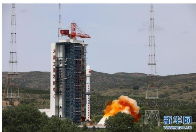
7月3日11时10分，我国在太原卫星发射中心用长征四号乙运载火箭，成功将高分辨率多模综合成像卫星送入预定轨道，发射获得圆满成功。任务搭载发射了“西柏坡号”科普卫星暨“八一02星”。