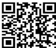
社会科学专技类B类