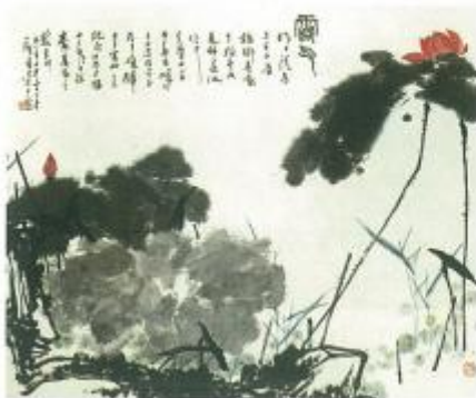
▲露气（中国画） 现代 潘天寿 画家非常注重画面的疏密、虚实对比与布局。如果我们用横、竖黄金分割线来分割画面，就会发现，其左下部是密，右上部是疏；这两部分如果是实，右下和左上两部分则是虚。完美的分割法则令作品具有了清爽、舒适的形式美感。