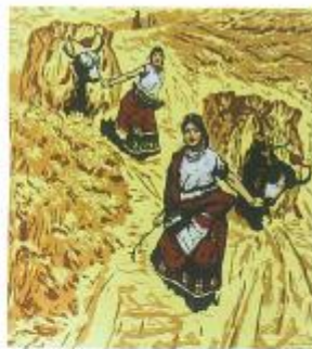
▲初踏黄金路（版画）现代 李焕民 画面中的人物、动物形象形成了视觉上一连串连续的点，S形的构图在使画面结构丰满的同时，又具有一种独特的节奏美、韵律美。