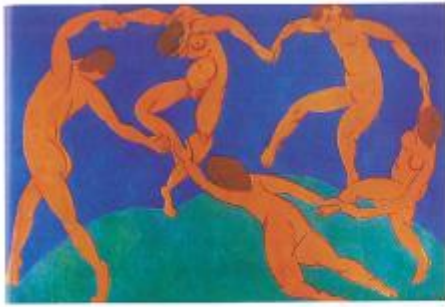
▲舞蹈（油画）现代 马蒂斯（法国） 画家采用圆形构图来安排作品中的人物形象，因而使画面看上去更加活泼和富有动感。