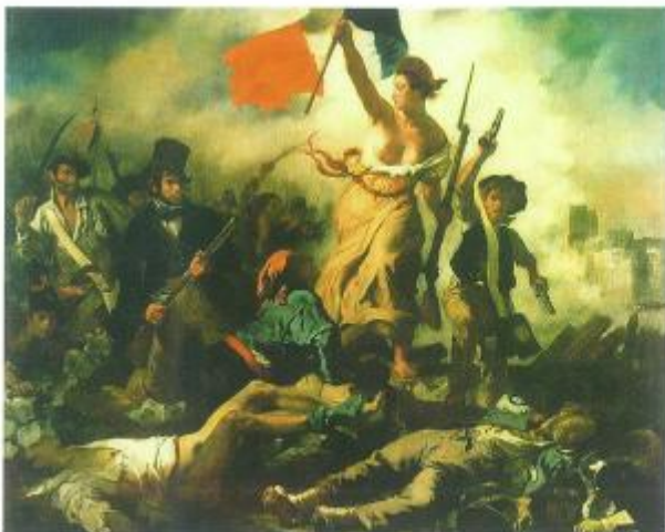
▲自由引导人民（油画）1830 德拉克洛瓦（法国） 此画是三角形构图的典范。画中象征自由、平等、博爱的三色旗位于等腰三角形的顶点，引导人民的自由女神处在横向黄金分割线处，巷战人群的头部位于纵向黄金分割线的位置。如此人物众多、宏伟而又动荡的战斗场面，被画家组织在了一个井然有序的畫面构图之中。

单独的造型要素只有经过合乎规律的组合，才能构成有审美价值的艺术形象。美术作品作为整体的审美对象，有着不同形式的整体结构，体现在绘画中就是构图形式。