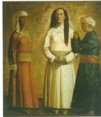
▼吉祥蒙古（油画）现代 书尔中 画家采用垂直构图的形式，将画面中的人物形象分割开来，表现出一种宁静、平和而自然的气息。

构图的方式有很多种，好的构图能完美地体现创作意图，并借助形象贴切地诠释所要表现的主题，令作品的表现力和感染力更加强烈。