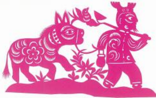
老汉牵驴（剪纸）现代 樊晓梅