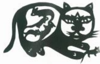
猫捉鼠（剪纸）现代 张蒲莲 北方剪纸多以粗犷简约为特征。