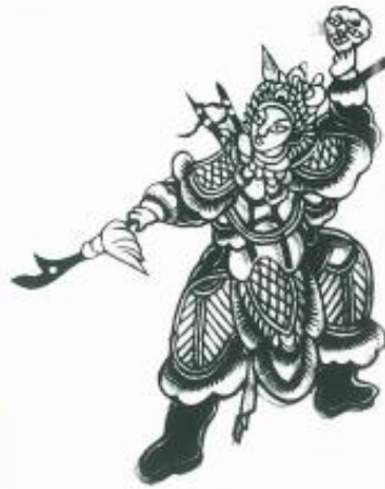
戏剧人物（剪纸）佚名 南方剪纸以精巧秀美著称。

剪纸采用镂空的方法时，图案必须线线相连，始终是一个整体。仔细看看这些图案是怎样连起来的。