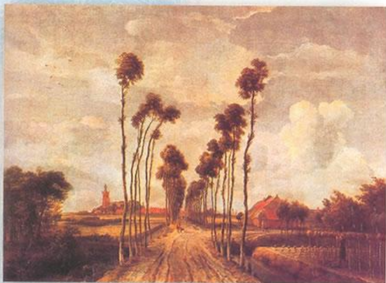
米德尔哈尔尼斯的道路（油画） 霍贝玛（荷兰）

霍贝玛是荷兰著名的风景画家。这张画的构图独特，画面中乡间小路两旁的树木由近及远，越来越小，最后消失在远方，形象地再现了近大远小的透视现象。作品体现了乡村生活的甜美，洋溢着明朗而宁静的乐观情绪。