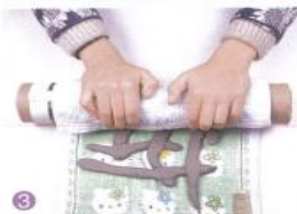
3 用毛巾兜着，将泥条围绕着纸筒卷一圈立好。