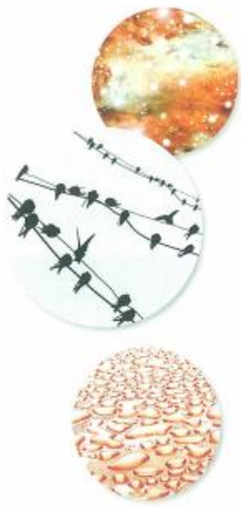
找一找生活中的点线面