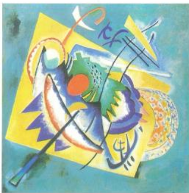
红色椭圆（油画）[现代] 康定斯基[俄罗斯]