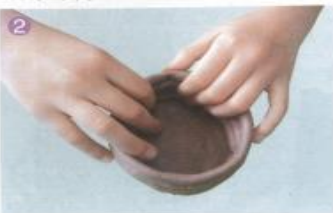
2 沿器底将泥条从下向上环绕盘筑。