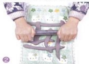
2 用木棒轻轻挤压泥条。