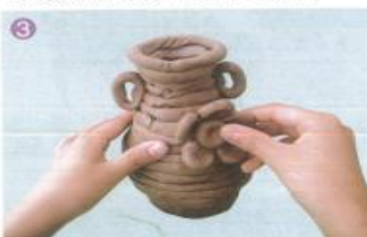
3 在器型外面施加装饰。