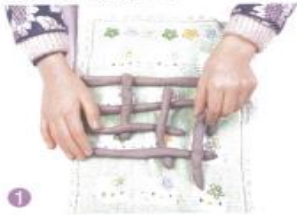
1 将搓好的泥条横竖交错揉放在毛巾上。