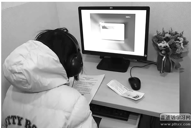
计算机辅助普通话水平测试考生