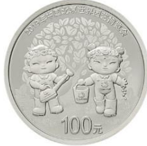
3克圆形精制铂质纪念币背面图案