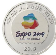
3克圆形精制铂质纪念币正面图案