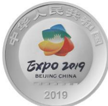
30克圆形精制银质纪念币正面图案