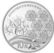
30克圆形精制银质纪念币背面图案