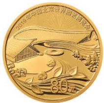
5克圆形精制金质纪念币背面图案